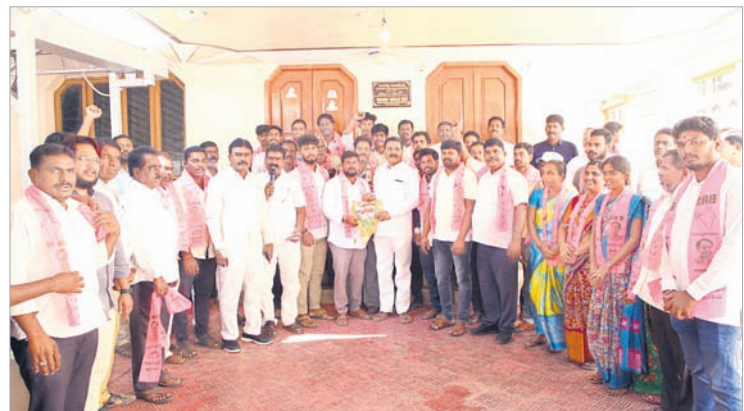
మంత్రి సమక్షంలో బీఆర్ఎస్ పార్టీలో చేరుతున్న నాయకులు (ఫైల్)