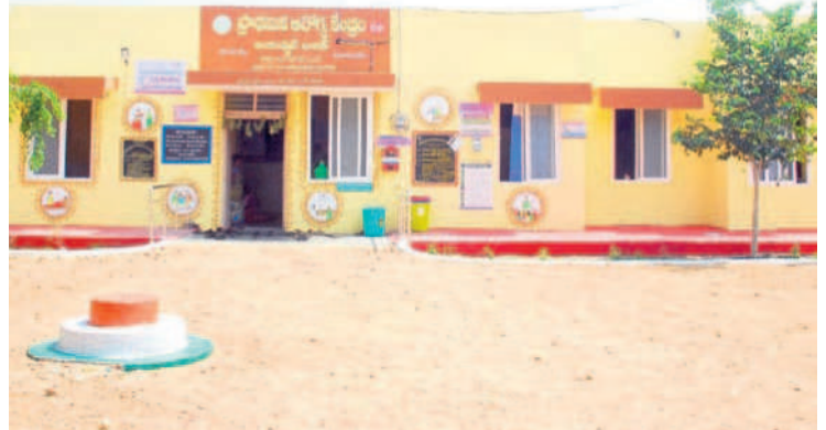
నర్స మండల కేంద్రంలో సీపీఎస్ఐ భవనం

శాతం గ్రామాలకు బీజీ, అంతర్గత సీసీ రోడ్లు, డ్రైనేజీల నిర్మాణ పనులు చేపట్టారు. ● గుడెబల్లూర్, కర్పి, భానా పుల్, ఓబ్లాపూర్ గ్రామాల్లో రూ.6 కోట్లతో సబ్ స్టేషన్లను నిర్మించారు. రూ.2.50 కోట్లతో ఫైర్ స్టేషన్ భవన పనులను ప్రారంభించారు. ● దేవరకల్-మునీరా బాద్ నూతన రైలు మార్గంలో భాగంగా నియోజకవర్గంలోని జక్కెర్, మక్తల్, మాగనూర్, కున్లిలో నాలుగు రైల్వే స్టేషన్లను పూర్తి చేయించి రాయచూర్ నుంచి కాచి గూడకు రైలు ప్రయాణ సౌకర్యం కల్పించారు. ● మరికల్, వాసునగర్, టై రోడ్డు నుంచి కృష్ణ మండలం వరకు 70 కిలో మీటర్ల మేర 167, 150 నాలుగు లేన్ల జాతీయ రహదారి పనులను పూర్తి చేయించారు.