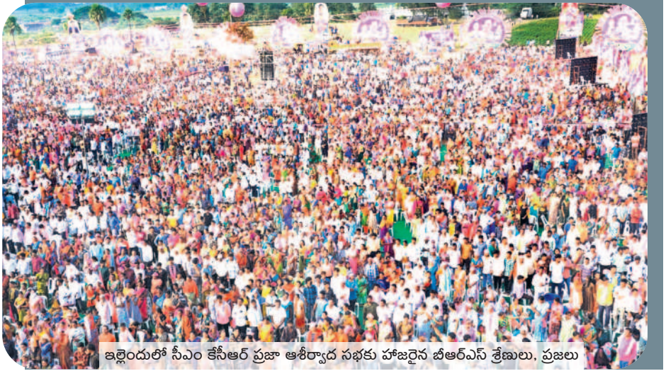
ఇల్లెందులో సీఎం కేసీఆర్ ప్రజా ఆశీర్వాద సభకు హాజరైన బీఆర్ఎస్ శ్రేణులు, ప్రజలు