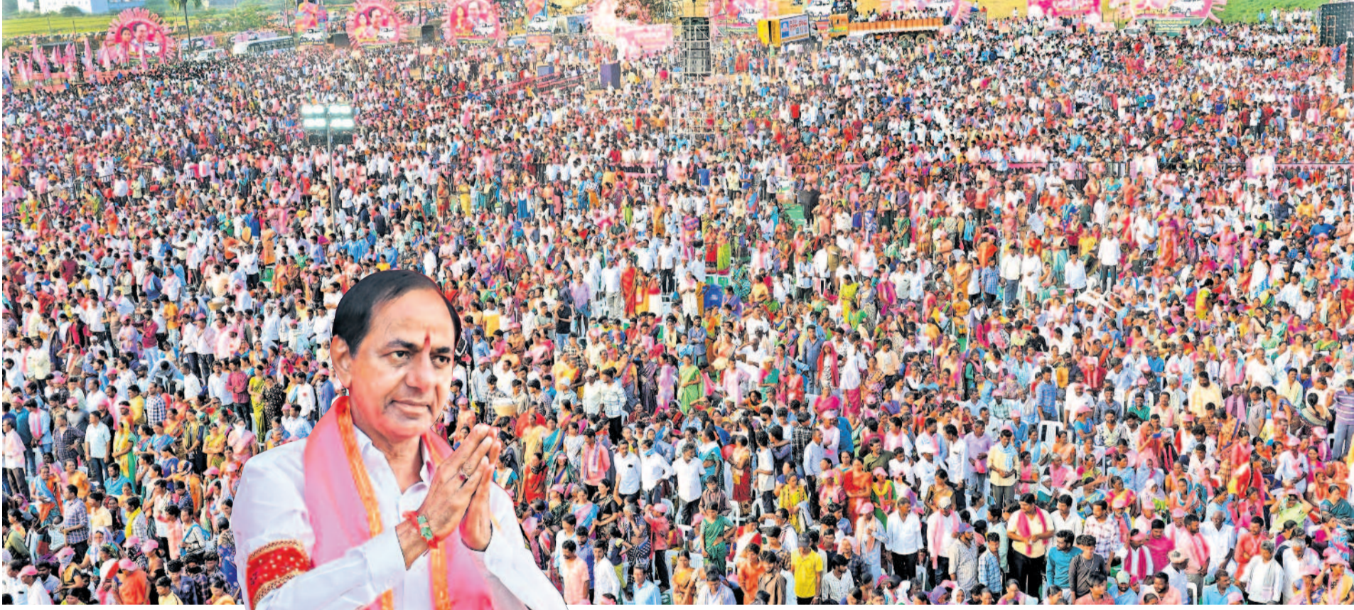
ఇల్లందు ప్రజా ఆశీర్వాద సభకు హాజరైన ఆసీప జనసాహసీకి లభించిన చెన్నై సీఎం కేసీఆర్

ఇవాళ పెదబొబ్బలు పెట్టే మూడు రంగుల జెండాలు, ఎర్రరేఖ జెండాలు, పచ్చరంగుల జెండాలు దళితులకు ఏం జేస్తాయి? గుండెమీద చెయ్యని అక్కలిమర్లు చేసుకోవాలి.. ఏ జెండా ఏం చేయాలి.. దళితులను ఓటు బ్యాంకుగా వాడుకున్నారే. ప్రధాని మోదీకి ప్రైవేట్ జేషన్ వీల్చి పట్టుకున్నది. విమానాశ్రయాలు, నౌకాశ్రయాలు, రైల్వేలు అన్నీ ప్రైవేటీకరణ చేస్తున్నారు. దివంగి ఈ దేశాన్ని ఏం చేస్తారో! -సీఎం కేసీఆర్