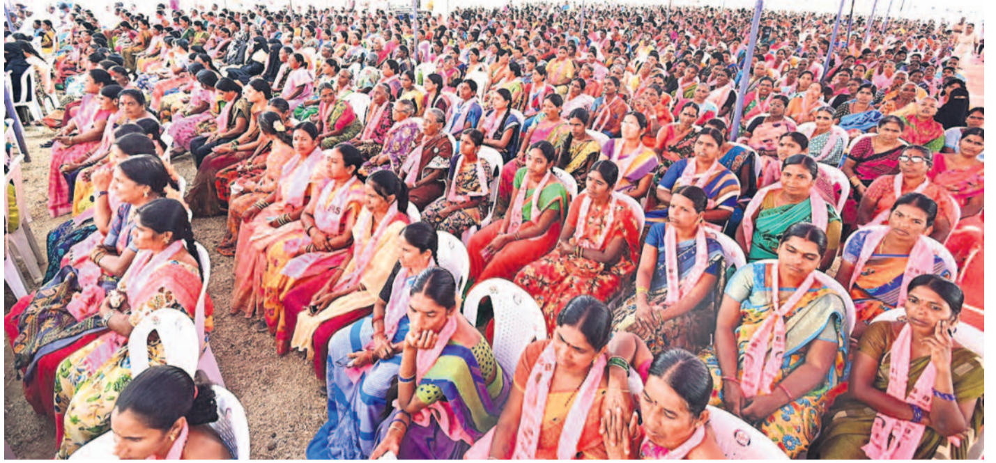
బుధవారం కామారెడ్డి జిల్లా భిక్కనూర్లో జరిగిన సమావేశానికి పెద్ద ఎత్తున హాజరైన బీఆర్ఎస్ పార్టీ మహిళా కార్యకర్తలు