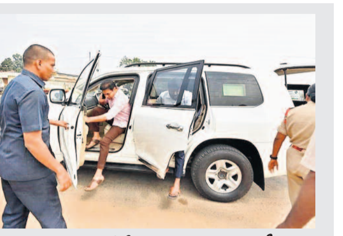
మంత్రి కేటీఆర్ వాహనం తనిఖీ మనోహరాబాద్, నవంబర్ 1: హైదరాబాద్ నుంచి కామారెడ్డి వెళ్తున్న మంత్రి కేటీఆర్ వాహనాన్ని మెదక్ జిల్లా మనోహరాబాద్ మండలం కాళ్ళకల్ వద్ద ఏర్పాటు చేసిన చిక్ పోస్టు వద్ద పోలీసులు, ఎన్ఫీకల సిబ్బంది ఆపి తనిఖీ చేశారు. వాహనం తనిఖీకి కేటీఆర్ పూర్తిగా సహకరించారు. తనిఖీ పూర్తయ్యే వరకు కారు దిగి వేచి చూశారు. అనంతరం కామారెడ్డి బయల్దేరారు.