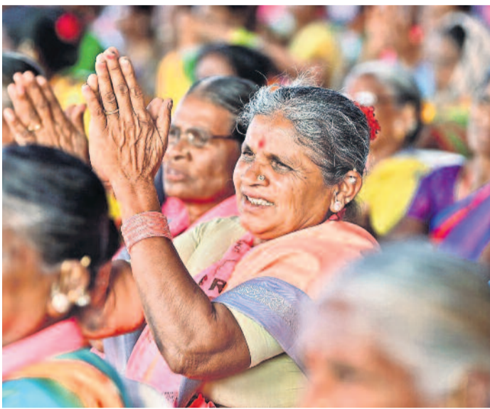
మంత్రి కేటీఆర్ ప్రసంగానికి చప్పట్లు కొడుతూ మధ్యతులు తెలుపుతున్న వ్యధులలు