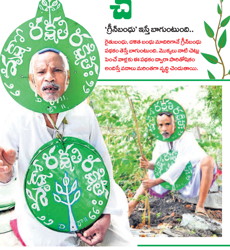
'గ్రీన్ బంధు' ఇన్ బాగుంటుంది.. రైతుబంధు, దళిత బంధు మాదిరిగానే గ్రీన్ బంధు పథకం తెచ్చి బాగుంటుంది. మొక్కలు నాటి చెట్లు పెంచే వాళ్ళకు ఈ పథకం ద్వారా పాఠశాలలు అందిస్తే వనాలు మరింతగా వృద్ధి చెందుతాయి.