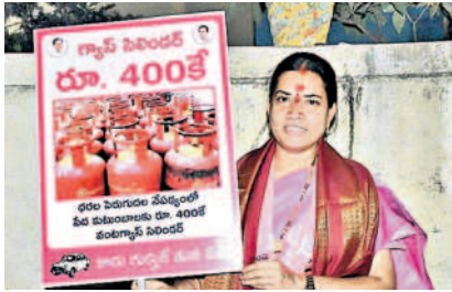
నాచారంలో ప్లకార్డు పట్టుకొని ప్రచారం చేస్తున్న స్టాండింగ్ కమిటీ మెంబర్, కార్పొరేటర్ శాంతి