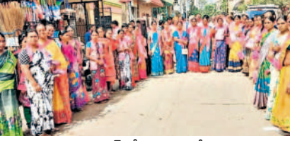
హబ్బిగూడ డివిజన్లో ప్రచారం చేస్తున్న మహిళలు