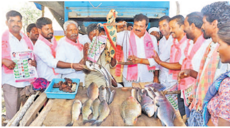
అందోల్: నేరడిగుంటలో చేపలు తూకం వేస్తున్న ఎమ్మెల్యే, బీఆర్ఎస్ అభ్యర్థి క్రాంతికిరణ్