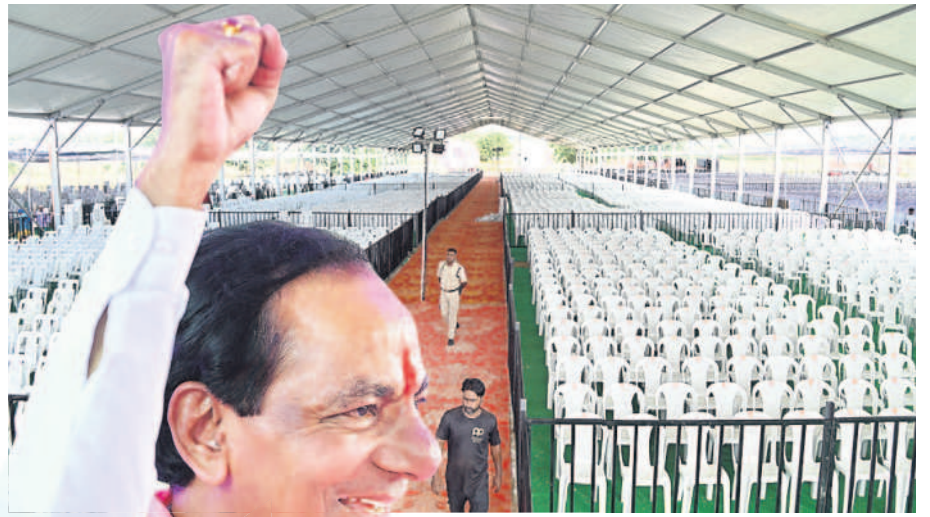
నిర్మల్ లో బహిరంగ సభ వద్ద ఏర్పాటు చేసిన కుర్చీలు