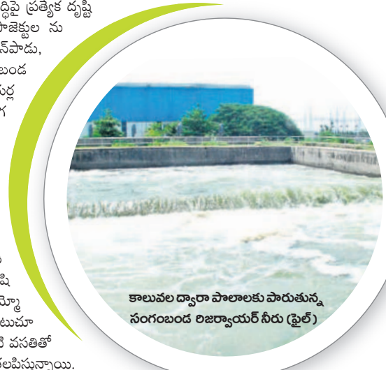
కాలువల ద్వారా పొలాలకు పారుతున్న సంగంబండ రిజర్వాయర్ నీరు (ఫైల్)