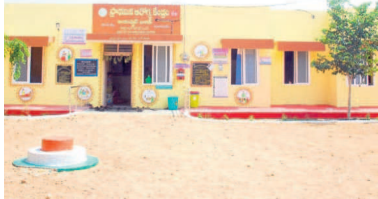
నర్స మండలకేంద్రంలో సిపిఎస్ నీ భవనం

సర్పంచులు, జెడ్పీ చైర్మన్లు, డీసీసీబీ చైర్మన్లు బీఆర్ఎస్ కు చెందిన వారే ఉన్నారు. దీంతో బీఆర్ఎస్ గ్రాఫ్ పెరిగింది. మక్తల్ గడ్డపై