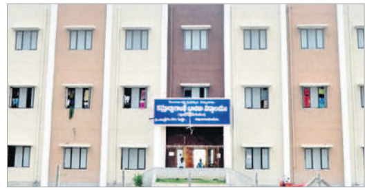
కృష్ణ మండలంలో నూతనంగా నిర్మించిన కేజీబీ కళాశాల

● మరికల్, వాసునగర్, టై రోడ్డు నుంచి కృష్ణ మండలం వరకు 70 కిలోమీటర్ల మేర 167, 150 నాలుగు లేన్ల జాతీయ రహదారి పనులను పూర్తి చేయించారు.