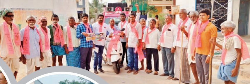
చౌదర్పల్లిలో ప్రచారం చేస్తున్న బీఆర్ఎస్ నాయకులు