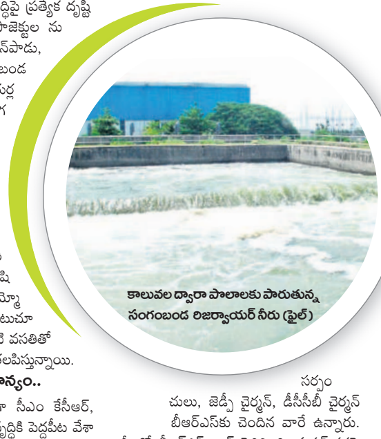
కాలువల ద్వారా పొలాలకు పారుతున్న సంగంబండ రిజర్వాయర్ నీరు (ఫైల్)