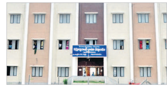
కృష్ణ మండలంలో నూతనంగా నిర్మించిన కేజీబీ కళాశాల