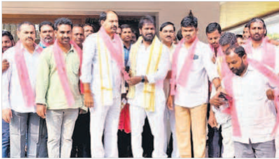
బీఆర్ఎస్ లో చేరిన వారికి గులాబీ కండువలు కప్పటను మంత్రి శ్రీనివాస్ గౌడ్