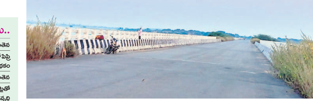
గోదావరి నదిపై రూ.100 కోట్లతో నిర్మించిన పంచగుడి వంతెన

నిర్మల్, నవంబర్ 1 (నమస్తే తెలంగాణ) : సీఎం కేసీఆర్ సుపూర్ సహకారం, ఎమ్మెల్యే విరల్ రెడ్డి నిరంతర శ్రమతో ముద్దోల్ నియోజకవర్గం అభివృద్ధి గమ్యాన్ని సాధించింది. ఏళ్ల నుంచి పరిష్కారానికి సోచుకొని అనేక సమస్యలను పరిష్కారం బీఆర్ఎస్ ప్రభుత్వ హయాంలో పూర్తవడంతో ఇక్కడి ప్రజానీకమంతా చూరాలిలాగా వ్యక్తం చేస్తున్నారు. రాబోయే ఎన్నికల్లో తాముకా బీఆర్ఎస్ నిర్మాణం చేశామని, ఎమ్మెల్యే విరల్ రెడ్డిని మరోసారి గెలిపించుకొని తమ బాధ్యతను నెరవేర్చుకుంటామని డీమా వ్యక్తం చేస్తున్నారు. ఎమ్మెల్యే విరల్ రెడ్డి గతంలో పరిష్కారం కానీ సమస్యలన్నీ దళవారీగా పరిష్కరించారు. ముఖ్యంగా నిజామాబాద్, నిర్మల్ జిల్లాలకు వారధిగా నిలిచే పంచగుడి వంతెన నిర్మాణం ఏళ్ల నుంచి వెండిగోల్లో ఉన్నది. ముద్దోల్ నియోజకవర్గానికి నిజామాబాద్ జిల్లాను అనుసంధానం చేసే ఈ వంతెనపై నాటి పాలకులు హామీ ఇచ్చినప్పటికీ నెరవేరలేదు. ఎమ్మెల్యే విరల్ రెడ్డి ఈ వంతెన నిర్మాణానికి ప్రతిపాదనలు రాపొందింది ప్రభుత్వానికి నివేదించారు. సీఎం కేసీఆర్ కు సమస్య తీవ్రతను వివరించారు. దీంతో ముఖ్యమంత్రి గోదావరిపై పంచగుడి వద్ద వంతెన నిర్మాణానికి రూ.100 కోట్లు మంజూరు చేశారు. నిధులు మంజూరు కాగానే పనులు చక్కచా పూర్తయి వంతెన నిర్మాణం