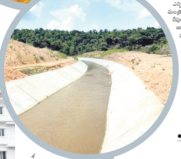
గోదావరి జలాలను ఎత్తిపోతల ద్వారా కాలువలోకి చేరుగులు పెడుతున్న నీరు