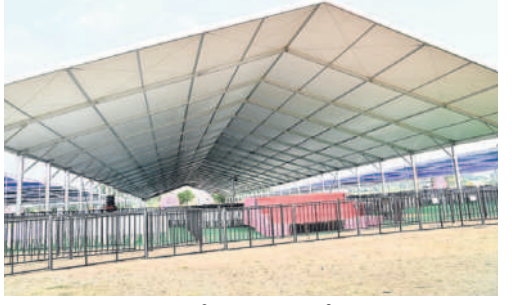
నిర్మల్ లో బహిరంగ సభ వేదిక

వాహనాలను మంచిర్యాల వారసా నుంచి డైరెక్ట్ చేస్తారు. సారంగాపూర్ నుంచి వచ్చే వాహనాలు మంగల్ పేట మీదుగా కలెక్టరేట్ రోడ్డు నుంచి సభా ప్రాంగణం దగ్గరకి చేరుకునేలా చర్యలు తీసుకుంటున్నారు. హైదరాబాద్ లో గురువారం మధ్యాహ్నం హైకోర్టులో బయల్ పడి ముఖ్యమంత్రి కేసీఆర్ నేరంగా నిర్మల్ చేరుకుంటారు. మధ్యాహ్నం 1 గంట నుంచి 2 గంటల వరకు జరిగే సభలో పాల్గొంటారు. అనంతరం హైకోర్టులో బయల్ పడి బాల్ గ్రౌండ్ లో నిర్వహించే ప్రజా ఆశీర్వాద సభకు వెళ్తారు.