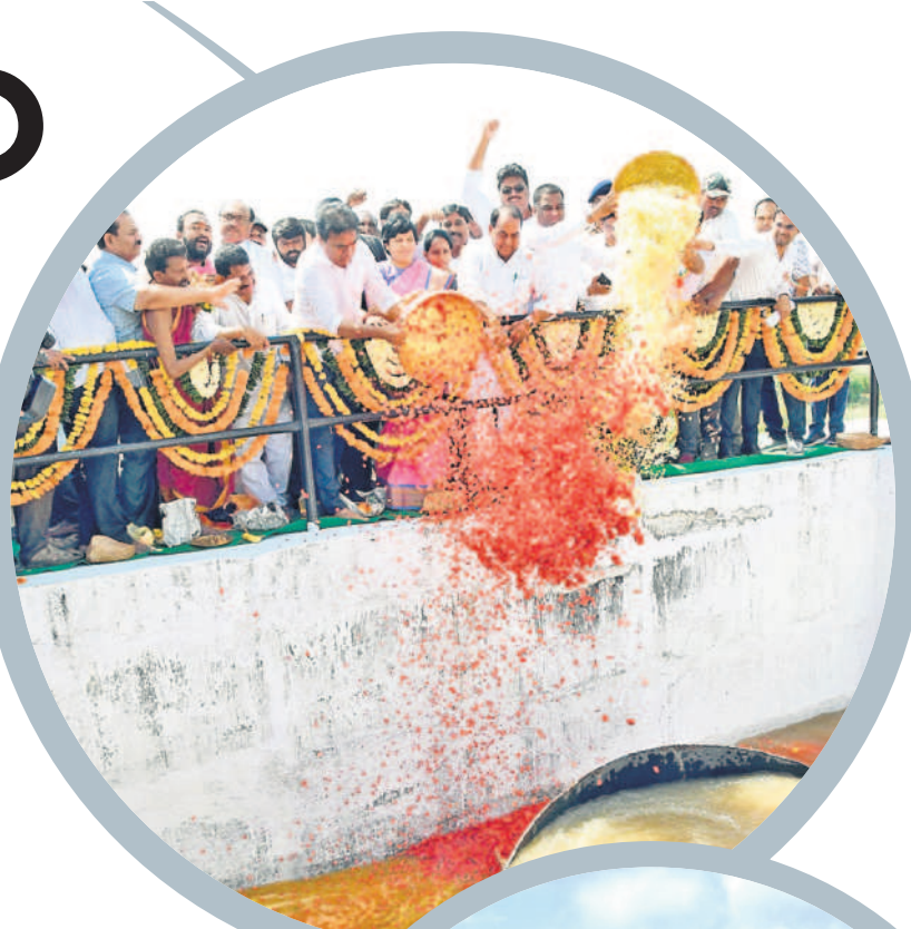
ఎత్తిపోతల ద్వారా కాలువలోకి చేరిన గోదావరి జలాలకు పూలు, వంద్యుల సారె సమర్పణపై మంత్రిలు కేటీఆర్, ఇతర

మండలం గుండంపెల్లి వద్ద ప్రారంభమయ్యే ఈ కాలువను ఎన్నో రెస్పి పునరుద్ధరణ పథకానికి అనుసంధానం చేసి ఇక్కడ ఎత్తిపోతల పథకాన్ని నిర్మించారు. కాగా ఈ హై లెవెల్ కాలువ దిలావరపూర్, నర్సాపూర్, కుంటూల మండలాలతోపాటు, సారంగాపూర్, నిర్మల్, మామడ, లక్ష్మణాచంద, సోన్ మండలాలలోని పొలాలకు వానకాలం, యాసంగి సీజనలకు సరిపడే సాగునీటిని అందించనుంది. అలాగే మామడ మండలం పొన్నల్ వద్ద రూ.800 కోట్లతో నిర్మించిన సడ రాల్స్ బ్యారేజీ ద్వారా నియోజకవర్గంలోని 18 వేల ఎకరాల ఆయకట్టుకు అదనంగా సాగు నీరు అందనుంది. ఈ పనులు ప్రస్తుతం బివెరి దశలో ఉన్నాయి. అంతేకాకుండా రూ.74 కోట్లతో 179 చెరువులను ఇప్పటికే పునరుద్ధరించడంతో దాదాపు 30 వేల ఎకరాల ఆయకట్టుకు సాగు నీరందతున్నది. దీంతోపాటు స్వర్ణ వాగుపై ఇప్పటికే రూ.46 కోట్లతో ఎనిమిది చోట్ల చెక్ డ్యామ్లను నిర్మించగా, తాజాగా ఇదే వాగుపై మరో ఐదు మంజూరయ్యాయి. వీటి నిర్మాణానికి రూ.28 కోట్లు ఖర్చు చేయనున్నారు. దీంతో ఓ వైపు సాగునీరు అందుబాటులోకి రాగా, మరోవైపు భూగర్భ జలాల వృద్ధికి ఈ చెక్ డ్యామ్లు దోహద పడుతున్నాయి. పశువులకు ఎండాకాలంలో కూడా తాగునీరు లభిస్తున్నది.