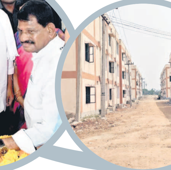
ఇటీవలే శ్రీలక్ష్మి సర్పంచ్ స్యామి ఎత్తిపోతల పథకాన్ని స్పెన్ ఆన్ చేసి ప్రారంభిస్తున్న మంత్రి కేటీఆర్