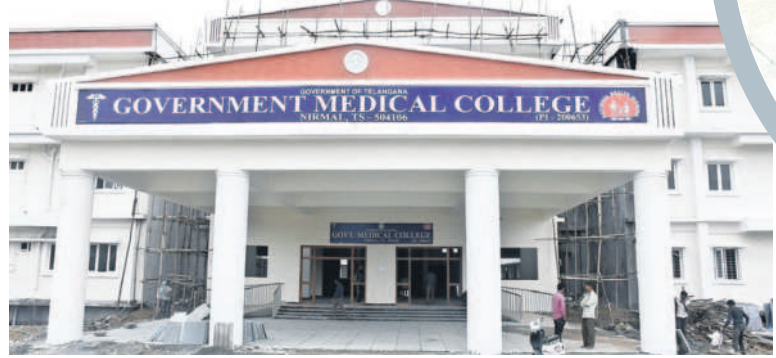
నిర్మల్ లో ఇటీవలే ప్రారంభమైన మెడికల్ కాలేజీ