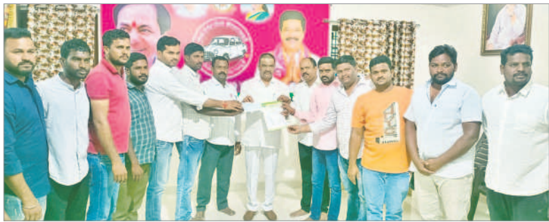
మంత్రి వేములకు చెక్కును అందిస్తున్న భీమ్గల్ కర్షకుల సంఘ సభ్యులు

కమ్యూన్ పల్లి/వేల్పూర్, నవంబర్ 1: బీఆర్ఎస్ పార్టీ అధినేత, సీఎం కేసీఆర్ నిజామాబాద్ జిల్లాలో పర్యటిం చున్నారు. ఎన్నికల పర్యటనలో భాగంగా ఆయన నేడు వేల్పూర్కు రానున్నారు. మంత్రి వేముల ఆధ్వర్యంలో నిర్వహించనున్న ప్రజా ఆశీర్వాద సభలో కేసీఆర్ ప్రసం గించనున్నారు. ప్రశాంతరెడ్డిని మరోమారు ఆశీర్వదించా లని, బీఆర్ఎస్ను గెలిపించాలని ప్రజలను కోరను న్నారు. కేసీఆర్ బహిరంగ సభను విజయవంతం చేసేందుకు మంత్రి వేముల భారీ ఏర్పాట్లు చేశారు. వేల్పూర్