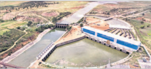
ఎస్సార్‌సీ పునర్నివ్వ పథకంతో ముప్పాల్ పంపు హౌస్ వద్ద ఎస్సార్‌సీలోకి విడుదలవుతున్న కాళేశ్వరం జలాలు

కమ్యూన్ పల్లి, నవంబర్ 1 : మంత్రి వేముల నాయకత్వంలో బాల్కొండ నియోజకవర్గం సమూల ప్రగతికి, అద్భుతమైన అభివృద్ధికి చిరునామాగా మారింది. దశాబ్దాలుగా పెండింగ్‌లో ఉన్న ప్రాజెక్టులకు కేసీఆర్ పాలనలో మోక్షం కలిగింది. తాగు, సాగునీటితో అల్లాడిపోయిన 'అల్లకొండ' నియోజకవర్గం ఇప్పుడు ఊట చెలిమెగా మారింది. ఎస్సార్‌సీ పునరుజ్జీవం, లిఫ్ట్లు, చెక్ డ్యాంల నిర్మాణంతో క'స్పీటి' కష్టాలకు చెక్ పడింది. సీఎం కేసీఆర్ సహకారంతో మంత్రి వేముల ప్రశాంతరెడ్డి బాల్కొండను అద్భుతంగా తీర్చిదిద్దారు. ఉద్ద్యమ నాయకుడైన కేసీఆర్‌కు సన్నిహితుడిగా ఉన్న వేముల.. భారీగా నిధులు తేవడంతో అన్ని రంగాల్లో సమూల ప్రగతికి చిరునామాగా బాల్కొండ నియోజక వర్గం నిలిచింది.