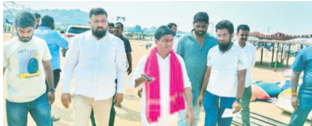
ఆర్కూర్లో సీఎం కేసీఆర్ సభ ఏర్పాట్లను పరిశీలిస్తున్న ఎమ్మెల్యే జీవన్‌రెడ్డి

బీఆర్ఎస్ శ్రేణులకు ఆర్కూర్ ఎమ్మెల్యే జీవన్‌రెడ్డి పిలుపు