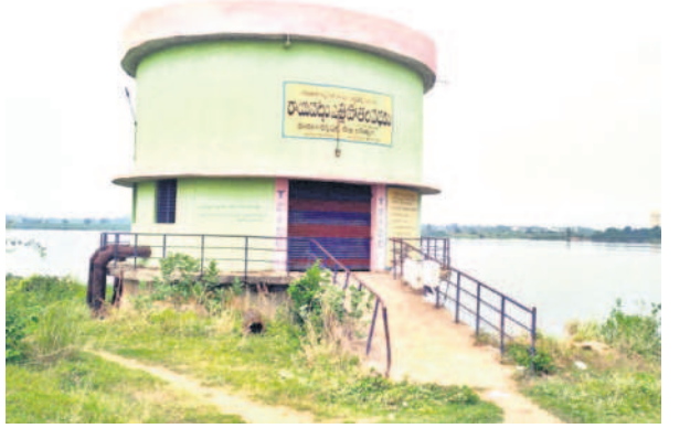
రాయపట్లం వద్ద నిర్మించిన ఎత్తిపోతల పథకం