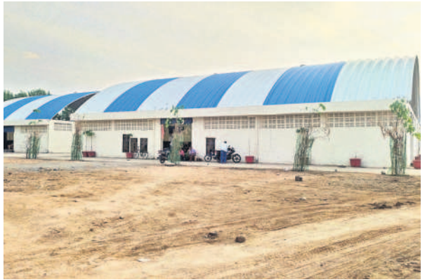
ధర్మపురిలో రూ.4కోట్లతో నిర్మించిన ఇంటర్నెట్ మాడల్స్

అన్ని మతాలను గౌరవిస్తూ నియోజకవర్గంలోని చర్మిలు, కల్లస్పాస్, మజీదుల నిర్మాణాలు, మరమ్మత్తులకు ₹14.39కోట్లు వెచ్చించారు. ఇందులో ఖల్లస్పాస్, మసీదులకు ₹4.74కోట్లు, చర్మిల మరమ్మత్తుకు ₹9.65కోట్లు వెచ్చించారు.