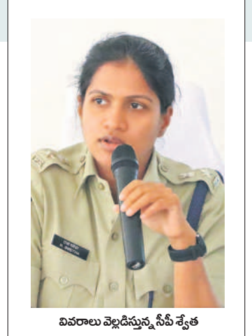
వివరాలు వెల్లడిస్తున్న సీపీ శ్వేత