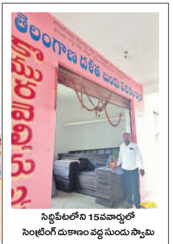
సిద్దిపేటలోని 15వ వార్డులో సింటింగ్ దుకాణం వద్ద ముందు స్వామి