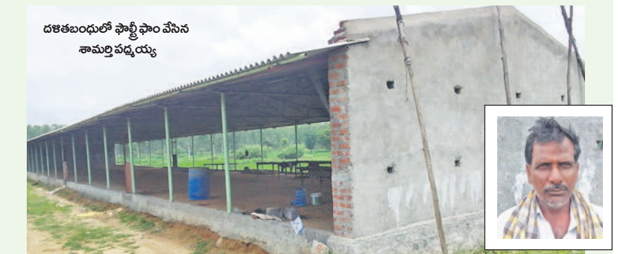
దళితబంధులో ఫ్యాబ్రికా పనిని కామర్షియల్ గా మార్చడం

దళితబంధు కార్యక్రమం ఇవాళ దేశానికి అదర్బంగా నిలుస్తున్నది. సీఎం కేసీఆర్ నాడు సిద్దిపేట ఎమ్మెల్యేగా ఉన్న సమయంలోనే దళిత చైతన్య జ్యోతి కార్యక్రమాన్ని చేపట్టారు. సుమారు 25 ఏండ్ల కిందట సిద్దిపేట నియోజకవర్గంలోని నంగనూరు మండలం మగ్గుంపూర్, చిన్నకోడూరు మండలం రామునిపట్ల గ్రామాలలో పాటు దుబ్బాక మండలం రాజకృష్ణపేట, ఎల్లాపూర్ గ్రామాల్లోని దళిత చైతన్య కార్యక్రమాన్ని చేపట్టారు. ప్రస్తుతం రాజకృష్ణపేట, ఎల్లాపూర్ గ్రామాల దుబ్బాక నియోజకవర్గంలో ఉన్నాయి. దళిత చైతన్య జ్యోతి కార్యక్రమం ఉద్దేశాలను అనాటి కేసీఆర్ వారికి వివరించి కార్యక్రమానికి శ్రీకారం చుట్టారు. మాడల్ గా తీసుకున్న గ్రామాల్లోని దళిత వాడకోటి అభివృద్ధికి ప్రణాళికలు రూపొందించి చేపట్టారు. అందరూ సంఘటితంగా ఉండి ఏదైనా సాధించవచ్చని చెప్పారు. దళితుల అభివృద్ధికి మాడల్ గా తీసుకున్న గ్రామాల్లోని వారి కోసం ట్రాక్టర్లు ఇప్పించారు. ఏ పని అయినా సామాజికంగా చేసుకోవాలని సూచించారు. సామాజిక వ్యవసాయ బావుల తవ్వకం కోసం క్రేన్ల ఇప్పించారు. ఇండ్లు కట్టుకునేలా ప్రోత్సహించి నిర్మించారు. శ్రమదానాలు చేసి రోడ్లు వేసుకున్నారు. ఇలా ఎన్నో పనులు చేపట్టారు. నాటి దళిత చైతన్య జ్యోతి కార్యక్రమం స్ఫూర్తితోనే ఇవాళ 'దళితబంధు' కార్యక్రమం ప్రవేశపెట్టి రాష్ట్రంలో దిగ్విజయంగా అమలు చేస్తున్నది.