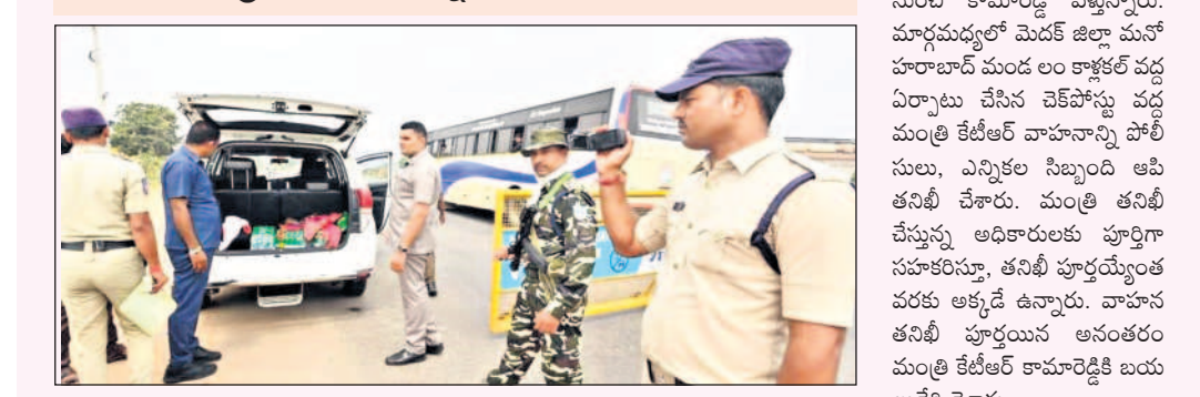
మనోహరాబాద్ మండలం కార్ల కల్ చెక్ పోస్టు వద్ద మంత్రి కేటీఆర్ వాహనాన్ని తనిఖీ చేస్తున్న పోలీసులు