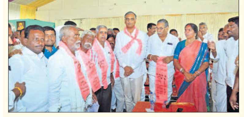
బీఆర్ఎస్ లో చేరుతున్న ఎల్లాపూర్ నాయకులు