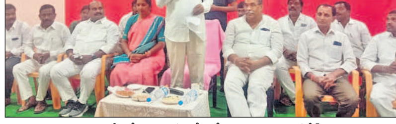
చిన్నకరంపేటలో కార్యక్రమ సమావేశంలో మాట్లాడుతున్న మంత్రి హరీశ్ రావు