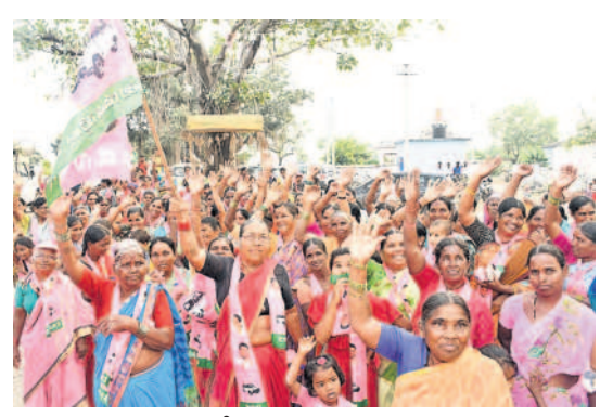
సమావేశాని హాజరైన మహిళలు