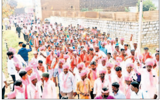
తొర్రామిడిలో భారీ ర్యాలీతో స్వాగతం పలుకుతున్న బీఆర్ఎస్ శ్రేణులు