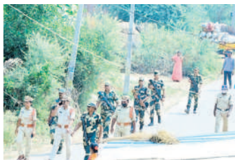
సీరోలులో కవాతు చేస్తున్న పోలీసులు