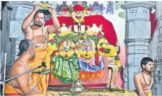
లక్ష్మీనరసింహుల తిరు కల్యాణోత్సవం జరిపిస్తున్న అర్చకులు

ఉత్తర గోపురం గుండా ఆలయంలోకి ప్రవేశించి తెలివిన అర్చకులు సుప్రభాతం తో స్వామిని మేల్కొల్పి తిరువారాధన జరిపి, ఉదయం ఆరగింపు చేపట్టారు.