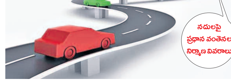
నదులపై ప్రధాన వంతెనల నిర్మాణ వివరాలు