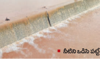
నీటిని ఒడిసి పట్టేలా చెక్ డ్యాం