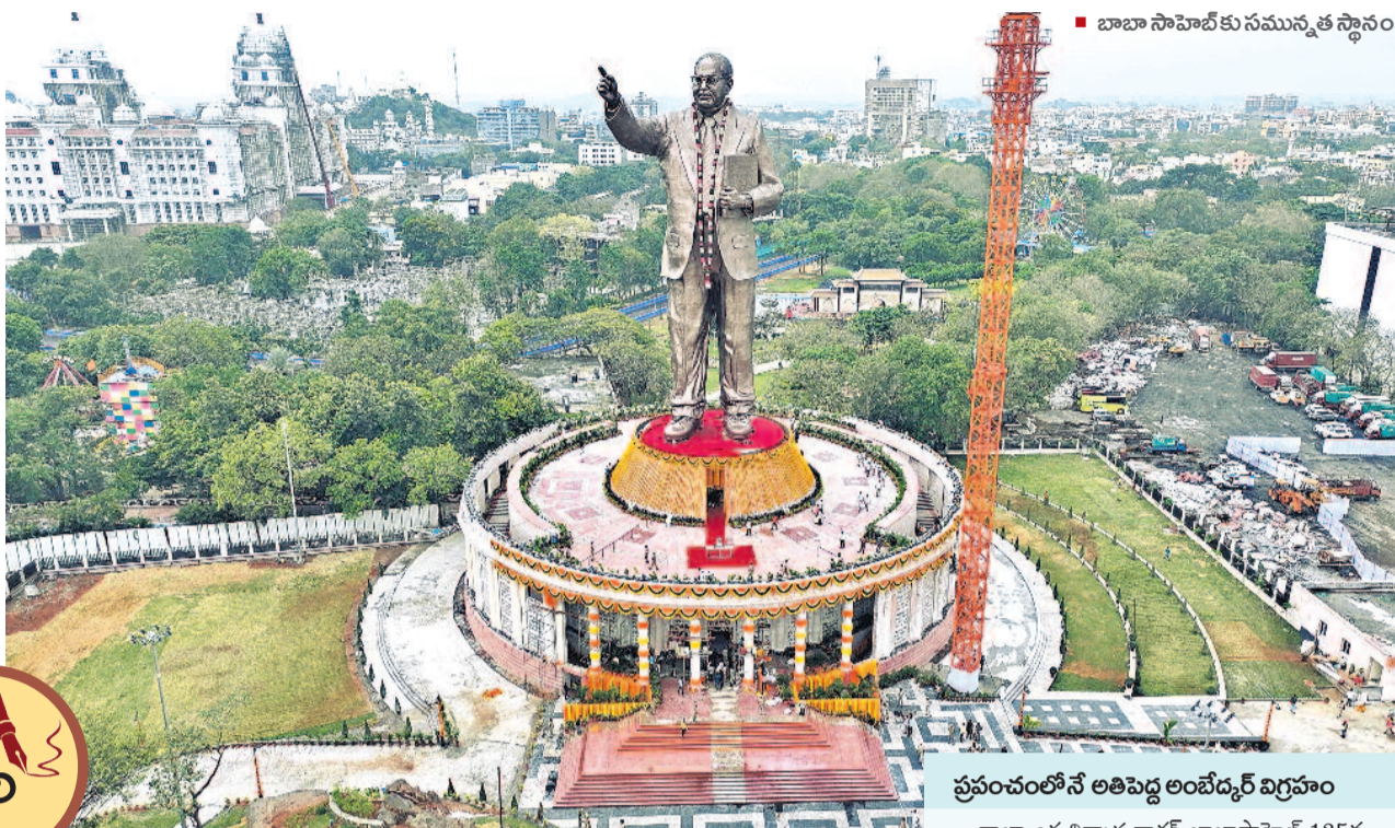
బాబా సాహెబ్ కు నమస్తే త స్థానం