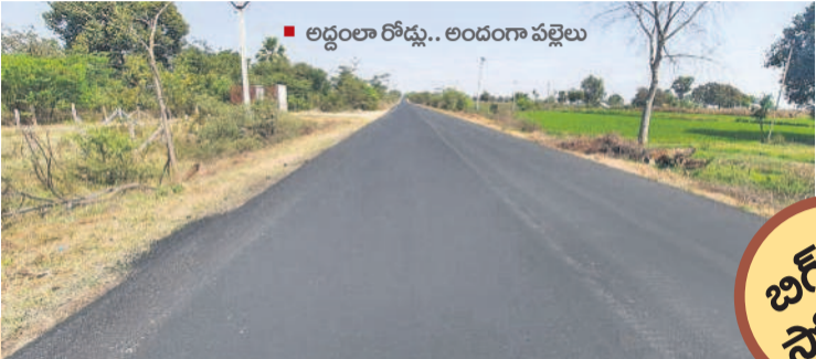
అద్దంలా రోడ్డు.. అందంగా వచ్చింది