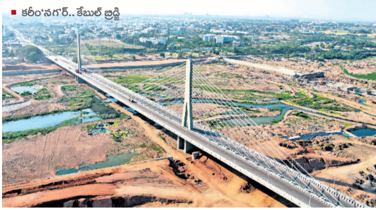
కరీంనగర్.. కేబుల్ బ్రిడ్జి