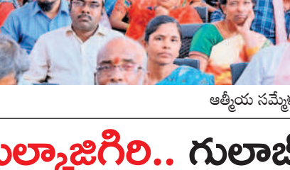
ఆత్మీయ సమావేశానికి తరలివస్తున్న గులాబీ దండు..