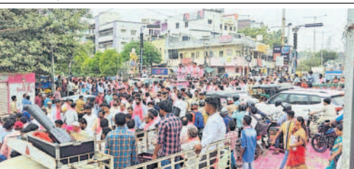
ఆత్మీయ సమావేశానికి తరలివస్తున్న గులాబీ దండు..