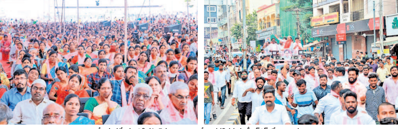
ఆత్మీయ సమ్మేళనానికి హాజరైన జనాలు.. భారీగా తరలివస్తున్న బీఆర్ఎస్ శ్రేణులు, ప్రజలు