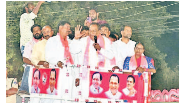
గుండ్లపోచంపల్లి ర్యాలీలో మాట్లాడుతున్న కార్మికశాఖ మంత్రి మల్లారెడ్డి

ကဝဋ္ဌ<del>ည်း ထ</del>ဝသိစ္ဆနီ ညွှဲ့နွံ့ ကစ္စဝည်