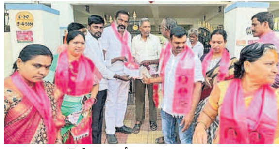
కమలానగర్లో ఇంటింటికీ ప్రచారం నిర్వహిస్తున్న నాయకులు