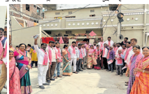
ఎంప్లాయీస్ కాలనీలో ప్రచారంలో పాల్గొన్న నాయకులు