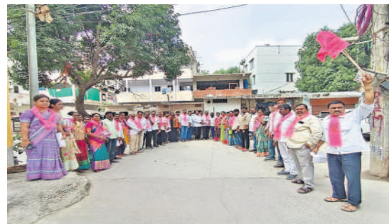
ಮಣಿ೯೦ಡಲ್ ಇಂಟಿಂಟಿಕೆ ಸ್ವವಾರಂಲ್ ಗುಲಾಬಿ ಸ್ಥತಿಣುಲು