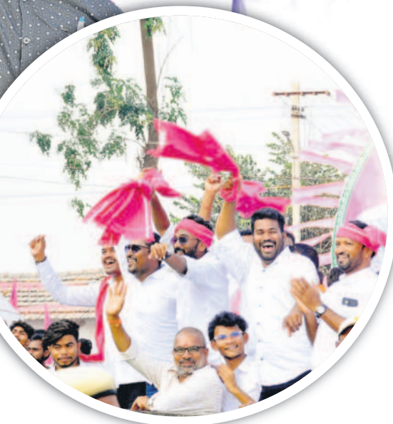
సభకు హాజరైన జననాహినీ