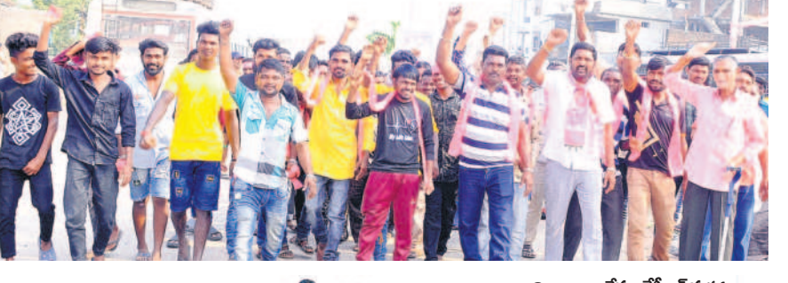
నినాదాలు చేస్తూ కేసీఆర్ సభకు వస్తున్న యువకులు