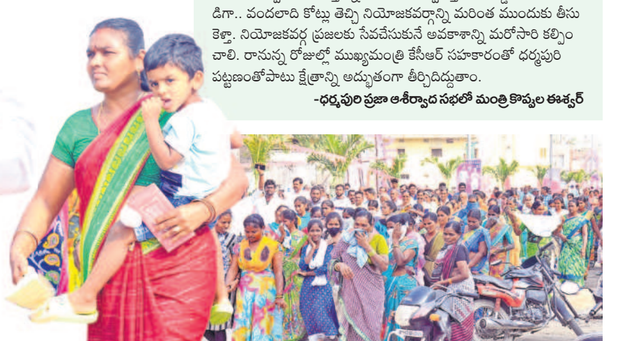
సీఎం సభకు తరలివచ్చిన మహిళలు