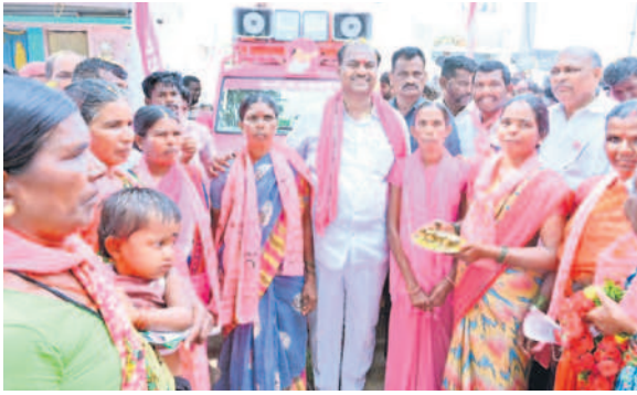
నేతువానిపల్లి తండాలో ఎమ్మెల్యే బండ్ల కృష్ణమోహన్ రెడ్డికి మంగళ హారతులతో స్వాగతం పలుకుతున్న గిరిజనులు