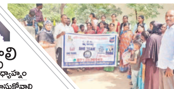
షీటీం ఆధ్వర్యంలో మహిళలకు అవగాహన కల్పిస్తున్న అధికారులు

అసెంబ్లీ ఎన్నికల్లో నామినేషన్ల స్వీకరణకు వేళైంది. శుక్రవారం ఎన్నికల నోటిఫికేషన్ విడుదల కానున్నది. ఈ నేపథ్యంలో నామినేషన్ల పర్వం మొదలు కానున్నది. 9వ తేదీన దివ్య మైన ముహూర్తం ఉండడంతో ఆ రోజు పెద్ద ఎత్తున వేసేందుకు ఫిక్స్ అయ్యారు. అభ్యర్థుల జాతక బలం మేరకు తేదీలు, టైం మేరకు మంచి ఘడియలు చూసుకుంటున్నారు. మరికొందరు సెంటిమెంట్ ప్రకారం వేసేందుకు రంగం సిద్ధం చేసుకున్నారు. ఒక్కొక్కరూ నాలుగైదు సెట్లు దాఖలు చేసే అవకాశం ఉన్నది. 10 వరకు స్వీకరించి.. 13న పరిశీలన చేసి, 15వ తేదీ వరకు ఉపసంహరణకు ఈసీ గ డువు విధించింది. 30న పోలింగ్, డిసెంబర్ 3న కౌంటింగ్ ప్రక్రియ కొనసాగునున్నది. ఇప్పటికే ఆయా నియోజకవర్గాలకు ఈవీఎలు చేరగా.. ఆయా జిల్లాల కలెక్టర్లు కట్టుదిట్టమైన ఏర్పాట్లు చేశారు. ఉమ్మడి జిల్లాలో మొత్తం 3,021 పోలింగ్ కేంద్రాలను ఏర్పాటు చేశారు. తమ ఓటు హక్కును స్వేచ్ఛగా వినియోగించుకునేందుకు అధికారులు గత ఎన్నికలకంటే ఎక్కువ పోలింగ్ కేంద్రాలను సిద్ధం చేశారు. మహబూబ్ నగర్ జిల్లాలో 517 పోలింగ్ కేంద్రాలు (107 సమస్యాత్మకం), నాగర్ కర్నూల్ లో 817 (276 సమస్యాత్మకం), వనపర్తిలో 541 (302 సమస్యాత్మకం), నారాయణపేటలో 553 (212 సమస్యాత్మకం), జోగుళాంబ గద్వాల జిల్లాలో 593 పోలింగ్ కేంద్రాలు (306 సమస్యాత్మకం) ఏర్పాటు చేశారు. ఇకపై అభ్యర్థులు ఖర్చు చేసే ప్రతి పైసా, లెక్కా పత్రమంతా అధికారుల చేతుల్లోనే ఉండనున్నది.