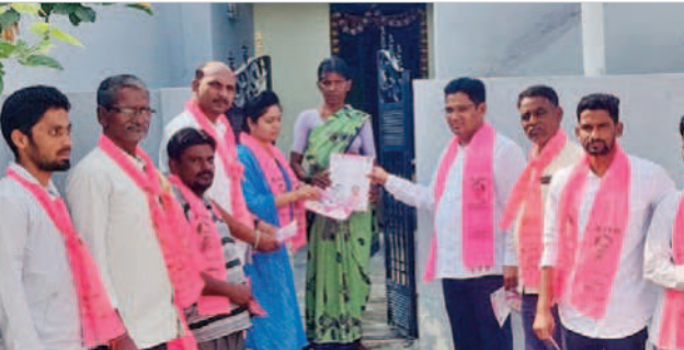
మక్తల్ పట్టణంలో ప్రచారం చేస్తున్న బీఆర్ఎస్ నాయకులు