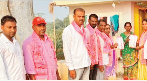
అమరచింత మండలంలో ప్రచారం చేస్తున్న బీఆర్ఎస్ నాయకులు