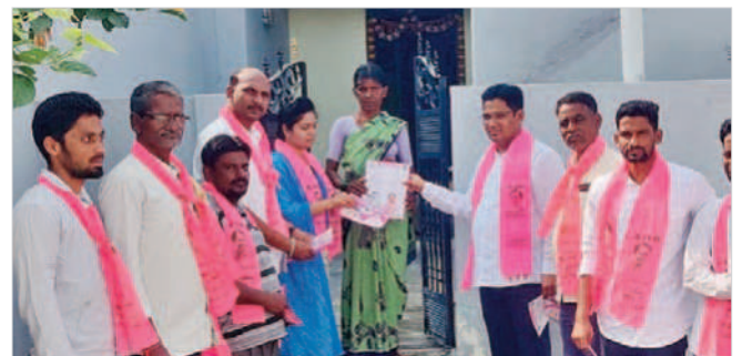
మక్తల్ పట్టణంలో ప్రచారం చేస్తున్న బీఆర్ఎస్ నాయకులు