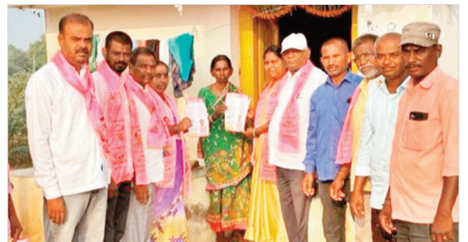
అమరచింత మండలంలో ప్రచారం చేస్తున్న బీఆర్ఎస్ నాయకులు