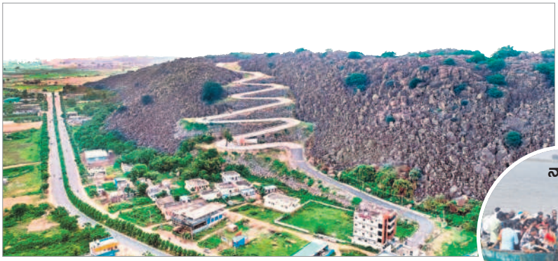
సుందరంగా మారిన ఆర్మూర్ సిద్దుల గుట్ట

నందిపేట్, నవంబర్ 2 : ఆర్మూర్ నియోజకవర్గం అభివృద్ధికి కేరాఫ్ ఆఫ్ అడ్రెస్ గా నిలుస్తున్నది. తొమ్మిదేండ్ల కాలంలో వందలాది కోట్ల నిధులతో అపూర్వమైన ప్రగతి సాధించింది. రోడ్లు, మురికి కాలువలు, వంతెనలు, దవాఖానాలు, పాఠశాలలు, కొత్త మండలాలు, రెవెన్యూ డివిజన్, కొత్త మండలాలు, కొత్త పంచాయతీల ఏర్పాటు, ఎత్తిపోతల పథకాల ఆధునికీకరణ, ఆర్మూర్ లోని సిద్దుల గుట్టకు ఘాట్ రోడ్డుతో పాటు గుట్టపై అభివృద్ధి పనులు, నిర్మాణాలు, ఆర్మూర్ ప్రభుత్వ దవాఖానలో కార్పొరేట్ స్థాయిలో వైద్య సేవలు, ఆయా గ్రామాల్లో బైపాస్ రోడ్ల నిర్మాణం, ప్రత్యేక నిధులతో ఆర్మూర్, నందిపేట్ పట్టణాల సుందరీకరణ ఇలా ఎన్నో ప్రగతి పనులతో ఆర్మూర్ నియోజకవర్గం అగ్రస్థానంలో నిలుస్తున్నది. రూ. 120 కోట్లతో గోదావరిపై వంతెన నిజామాబాద్, నిర్మల్ జిల్లాలను కలుపుతూ నందిపేట్ మండలం ఉమ్మడి పాత గ్రామం వద్ద గోదావరి నదిపై నిర్మించిన వంతెన రెండు ప్రాంతాల ప్రజలకు సౌకర్యవంతంగా మారింది. సుమారు రూ. 120 కోట్లతో నదిపై వంతెన నిర్మించడంతో 50 కిలో మీటర్ల చుట్టూ