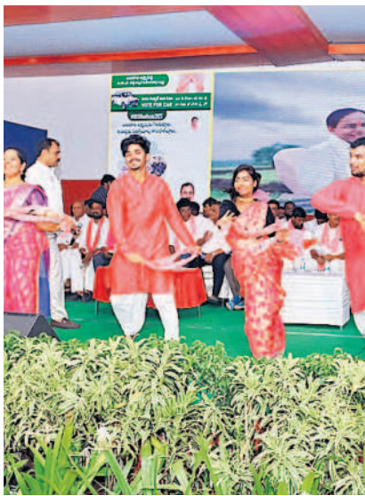
సభకు ముందు నిర్వహించిన తెలంగాణ సాంస్కృతిక కార్యక్రమాలు, ఆటా పాటా ...