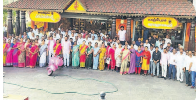
మంత్రి కేటీఆర్ సమావేశానికి తరలివెళ్తున్న ఎవినరావునగర్ డివిజన్ నాయకులు