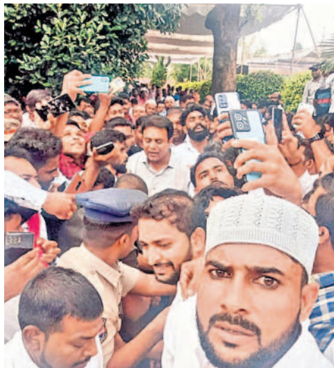
మల్లాపూర్ వీఎన్ఆర్ గార్డెన్స్ లో కేటీఆర్ సభ సందర్భంగా మంత్రి కేటీఆర్ తో సెల్ఫీ కోసం ఎగబడుతున్న బీఆర్ఎస్ కార్యకర్తలు