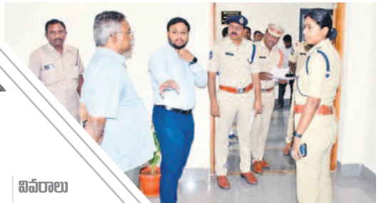
నామినేషన్ స్వీకరణకు ఏర్పాట్లను పరిశీలిస్తున్న కలెక్టర్, ఎస్పీ