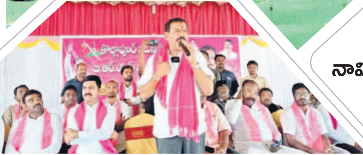
కొల్లాపూర్ ఆత్మీయ సమ్మేళనంలో మాట్లాడుతున్న ఎమ్మెల్యే బిరం