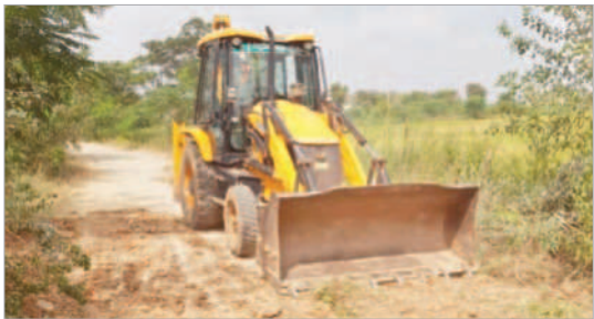
అప్పారెడ్డిపల్లి ప్రధాన రహదారిపై గుంతలను చదును చేస్తున్న జేసీబీ