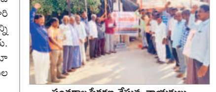
సంతకాల సేకరణ చేస్తున్న నాయకులు