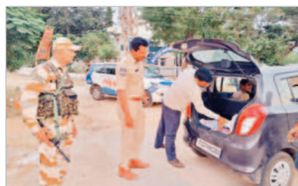
ఖిల్లాలో వాహనాలను తనిఖీ చేస్తున్న పోలీసులు

ఖిల్లాపూర్, నవంబర్ 2: రానున్న అసెంబ్లీ ఎన్నికల నేపథ్యంలో మద్యం, డబ్బు తదితర వస్తువుల సరఫరాలను అడ్డుకునేందుకు మండల కేంద్రంలో పోలీసులు ముమ్మరంగా తనిఖీలు చేపడుతున్నారు. అందులో భాగంగానే గురువారం మండల కేంద్రంలో కేంద్ర సాయుధ బలగాలతో కలిసి పోలీసులు వాహనాలను తనిఖీలు చేశారు. ఎవరైనా అక్రమంగా మద్యం, డబ్బు తరలిస్తే చర్యలు తీసుకుంటామని హెచ్చరించారు. రూ.50వేల కన్నా ఎక్కువ నగదు ఉంటే వాటికి సంబంధించిన రసీదులను చూపించాలని తెలిపారు.