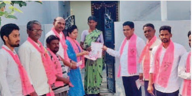
మక్తల్ పట్టణంలో ప్రచారం చేస్తున్న బీఆర్ఎస్ నాయకులు