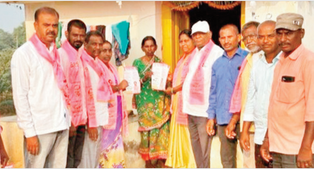
అమరచింత మండలంలో ప్రచారం చేస్తున్న బీఆర్ఎస్ నాయకులు