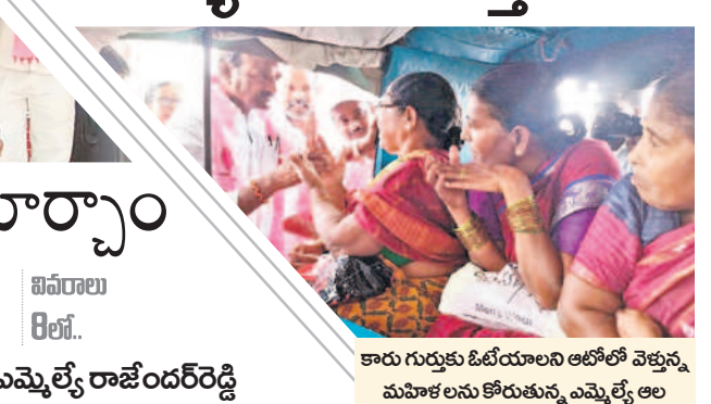
కారు గుర్తుకు ఓటియాలని ఆటోలో వెళ్తున్న మహిళలను కోరుతున్న ఎమ్మెల్యే ఆల

అసెంబ్లీ ఎన్నికల్లో నామినేషన్ల స్వీకరణకు వేళైంది. శుక్రవారం ఎన్నికల నోటిఫికేషన్ విడుదల కానున్నది. ఈ నేపథ్యంలో నామినేషన్ల పర్వం మొదలు కానున్నది. 9వ తేదీన దివ్య మైన ముహూర్తం ఉండడంతో ఆ రోజు పెద్ద ఎత్తున వేసేందుకు ఫిక్స్ అయ్యారు. అభ్యర్థుల జాతక బలం మేరకు తేదీలు, టైం మేరకు మంచి ఘడియలు చూసుకుంటున్నారు. మరికొందరు సెంటిమెంట్ ప్రకారం వేసేందుకు రంగం సిద్ధం చేసుకున్నారు. ఒక్కొక్కరూ నాలుగైదు సెట్లు దాఖలు చేసి అవకాశం ఉన్నది. 10 వరకు స్వీకరించి.. 13న పరిశీలన చేసి, 15వ తేదీ వరకు ఉపసంహరణకు ఈసీ గ డువు విధించింది. 30న పోలింగ్, డిసెంబర్ 3న కౌంటింగ్ ప్రక్రియ కొనసాగునున్నది. ఇప్పటికే ఆయా నియోజకవర్గాలకు ఈవీఎంలు చేరగా.. ఆయా జిల్లాల కలెక్టర్లు కట్టుదిట్టమైన ఏర్పాట్లు చేశారు. ఉమ్మడి జిల్లాలో మొత్తం 3,021 పోలింగ్ కేంద్రాలను ఏర్పాటు చేశారు. తమ ఓటు హక్కును స్వేచ్ఛగా వినియోగించుకునేందుకు అధికారులు గత ఎన్నికలకంటే ఎక్కువ పోలింగ్ కేంద్రాలను సిద్ధం చేశారు. మహబూబ్ నగర్ జిల్లాలో 517 పోలింగ్ కేంద్రాలు (107 సమస్యాత్మకం), నాగర్ కర్నూల్ లో 817 (276 సమస్యాత్మకం), వనపర్తిలో 541 (302 సమస్యాత్మకం), నారాయణపేటలో 553 (212 సమస్యాత్మకం), జోగుళాంబ గద్వాల జిల్లాలో 593 పోలింగ్ కేంద్రాలు (306 సమస్యాత్మకం) ఏర్పాటు చేశారు. ఇకపై అభ్యర్థులు ఖర్చు చేసే ప్రతి పైసా, లెక్కా పత్రమంతా అధికారుల చేతుల్లోనే ఉండనున్నది.