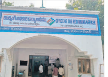
దేవరకర్ణ రిటర్నింగ్ అధికారి కార్యాలయం

మహబూబ్ నగర్, నవంబర్ 2 : 30వ తేదీన జరిగే అసెంబ్లీ ఎన్నికలకు దేవరకర్ణ నియోజకవర్గ కేంద్రంలోని రిటర్నింగ్ అధికారి కార్యాలయాన్ని సిద్ధం చేశారు. ఎమ్మెల్యే అభ్యర్థుల నామినేషన్ స్వీకరణ ఈనెల 3వ తేదీ