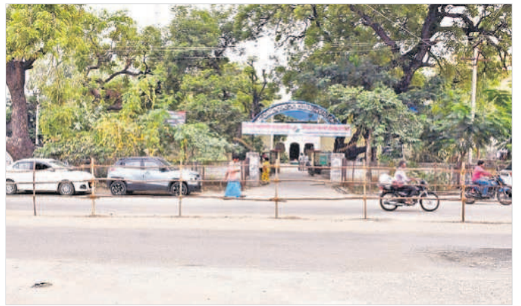
నారాయణపేటలోని అడ్మిన్ కార్యాలయం వద్ద ఏర్పాటు చేసిన నామినేషన్ సెంటర్

9న నామినేషన్లకు ముహూర్తం ఎన్నికల్లో గెలవాలనే లక్ష్యంతో ఆయా పార్టీలకు చెందిన అభ్యర్థులు తమ జాతక బలం మేరకు తేదీలు, టైం ప్రకారం నామినేషన్లు వేయడానికి ముహూర్తం పెట్టుకున్నారు. మరికొందరు అభ్యర్థులు సెంటిమెంట్ ప్రకారం వేయడానికే ఎక్కువగా ఇష్టపడతారు. కాగా బీఆర్ఎస్ అభ్యర్థులు ఉమ్మడి జిల్లాలో 9న పెద్ద ఎత్తున నామినేషన్లు వేసేందుకు ముహూర్తం ఖరారు చేసుకున్నారు. అదే రోజు పార్టీ అధినేత కేసీఆర్ తన నామినేషన్ దాఖలు చేస్తుండటంతో చాలా మంది అభ్యర్థులు అదే తేదీని ఎంచుకున్నారు. నామినే