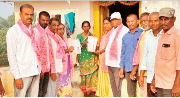
అమరచింత మండలంలో ప్రచారం చేస్తున్న బీఆర్ఎస్ నాయకులు