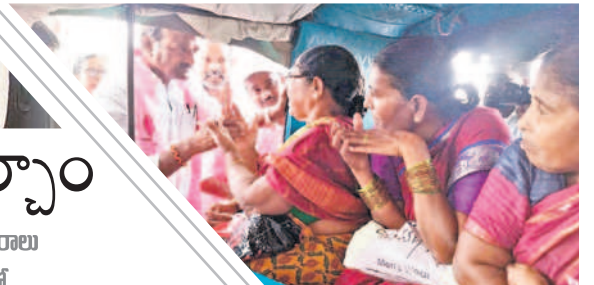
కారు గుర్తుకు ఓటియాలని ఆటోలో వెళ్తున్న మహిళలను కోరుతున్న ఎమ్మెల్యే ఆల

అసెంబ్లీ ఎన్నికల్లో నామినేషన్ల స్వీకరణకు వేళైంది. శుక్రవారం ఎన్నికల నోటిఫికేషన్ విడుదల కానున్నది. ఈ నేపథ్యంలో నామినేషన్ల పర్వం మొదలు కానున్నది. 9వ తేదీన దివ్య మైన ముహూర్తం ఉండడంతో ఆ రోజు పెద్ద ఎత్తున వేసేందుకు ఫిక్స్ అయ్యారు. అభ్యర్థుల జాతక బలం మేరకు తేదీలు, టైం మేరకు మంచి ఘడియలు చూసుకుంటున్నారు. మరికొందరు సెంటిమెంట్ ప్రకారం వేసేందుకు రంగం సిద్ధం చేసుకున్నారు. ఒక్కొక్కరూ నాలుగైదు సెట్లు దాఖలు చేసి అవకాశం ఉన్నది. 10 వరకు స్వీకరించి.. 13న పరిశీలన చేసి, 15వ తేదీ వరకు ఉపసంహరణకు ఈసీ గ డువు విధించింది. 30న పోలింగ్, డిసెంబర్ 3న కౌంటింగ్ ప్రక్రియ కొనసాగునున్నది. ఇప్పటికే ఆయా నియోజకవర్గాలకు ఈవీఎలు చేరగా.. ఆయా జిల్లాల కలెక్టర్లు కట్టుదిట్టమైన ఏర్పాట్లు చేశారు. ఉమ్మడి జిల్లాలో మొత్తం 3,021 పోలింగ్ కేంద్రాలను ఏర్పాటు చేశారు. తమ ఓటు హక్కును స్వేచ్ఛగా వినియోగించుకునేందుకు అధికారులు గత ఎన్నికలకంటే ఎక్కువ పోలింగ్ కేంద్రాలను సిద్ధం చేశారు. మహబూబ్ నగర్ జిల్లాలో 517 పోలింగ్ కేంద్రాలు (107 సమస్యాత్మకం), నాగర్ కర్నూల్ లో 817 (276 సమస్యాత్మకం), వనపర్తిలో 541 (302 సమస్యాత్మకం), నారాయణపేటలో 553 (212 సమస్యాత్మకం), జోగుళాంబ గద్వాల జిల్లాలో 593 పోలింగ్ కేంద్రాలు (306 సమస్యాత్మకం) ఏర్పాటు చేశారు.