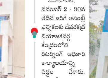
దేవరకర్ణ రిటర్నింగ్ అధికారి కార్యాలయం

మహబూబ్ నగర్, నవంబర్ 2 : 30వ తేదీన జరిగే అసెంబ్లీ ఎన్నికలకు దేవరకర్ణ నియోజకవర్గ కేంద్రంలోని రిటర్నింగ్ అధికారి కార్యాలయాన్ని సిద్ధం చేశారు. ఎమ్మెల్యే అభ్యర్థుల నామినేషన్ స్వీకరణ ఈనెల 3వ తేదీ నుంచి ప్రారంభిస్తారు. ఎన్నికలకు మొత్తం 289 పోలింగ్ కేంద్రాలను ఏర్పాటు చేశారు. అర్బన్ పోలింగ్ కేంద్రాలు 31, రూరల్ పోలింగ్ కేంద్రాలు 258 ఉన్నాయి. నియోజకవర్గంలోని సమస్యాత్మక పోలింగ్ కేంద్రాలు 44 ఉండగా, సమస్యాత్మక పోలింగ్ కేంద్రాలు 101 ఉన్నట్లు తెలిపారు. దేవరకర్ణ నియోజకవర్గ కేంద్రం మొత్తం 8మండలాల్లో కలిపి పురుషులు 1,13,258 ఓటర్లు ఉండగా, మహిళలు 1,14,556 ఓటర్లు ఉన్నారు. మొత్తం 2,28,084 మంది ఓటర్లు ఉన్నారు.