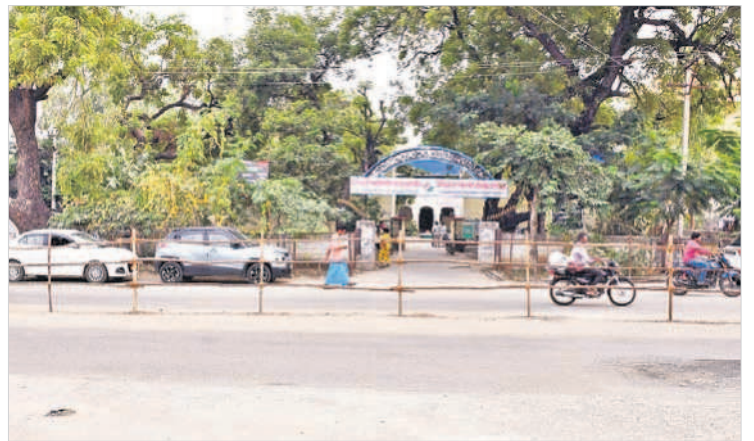
నారాయణపేటలోని అడ్మిన్ కార్యాలయం వద్ద ఏర్పాటు చేసిన నామినేషన్ సెంటర్

9న నామినేషన్లకు ముహూర్తం ఎన్నికల్లో గెలవాలనే లక్ష్యంతో ఆయా పార్టీలకు చెందిన అభ్యర్థులు తమ జాతక బలం మేరకు తేదీలు, టైం ప్రకారం నామినేషన్లు వేయడానికి ముహూర్తం పెట్టుకున్నారు. మరికొందరు అభ్యర్థులు సెంటిమెంట్ ప్రకారం వేయడానికే ఎక్కువగా ఇష్టపడతారు. కాగా బీఆర్ఎస్ అభ్యర్థులు ఉమ్మడి జిల్లాలో 9న పెద్ద ఎత్తున నామినేషన్లు వేసేందుకు ముహూర్తం ఖరారు చేసుకున్నారు. అదే రోజు పార్టీ అధినేత కేసీఆర్ తన నామినేషన్ దాఖలు చేస్తుండటంతో చాలా మంది అభ్యర్థులు అదే తేదీని ఎంచుకున్నారు. నామినే