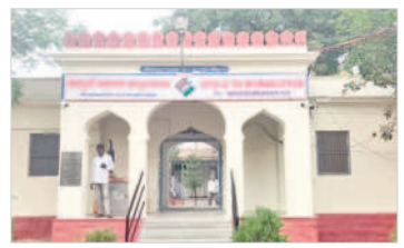
రిటర్నింగ్ అధికారి కార్యాలయం