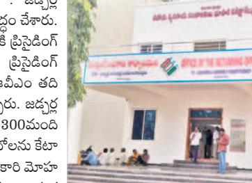
జడ్పర్లోని అసెంబ్లీ రిటర్నింగ్ అధికారి కార్యాలయం

జడ్పర్, నవంబర్ 2 : జడ్పర్ అసెంబ్లీ ఎన్నికలకు సర్వసిద్ధం చేశారు. ఇప్పటికే ఎన్నికల సిబ్బందికి ట్రైనింగ్ అధికారులకు, అసిస్టెంట్ ట్రైనింగ్ అధికారులకు ఓటింగ్, ఈవీఎం తదితర అంశాలపై శిక్షణ ఇచ్చారు. జడ్పర్ నియోజకవర్గంలో మొత్తం 300మంది పీవోలు, 300మంది ఏపీవోలను కేటాయించారు. రిటర్నింగ్ అధికారి మోహన్ రావు పర్యవేక్షిస్తున్నారు. జడ్పర్ నియోజకవర్గంలో మొత్తం 2,12,395మంది ఓటర్లు ఉన్నారు. పురుషులు 1,06,922, మహిళా ఓటర్లు 1,05,649 మంది ఉన్నారు. నియోజకవర్గంలో జడ్పర్, రాజాపూర్, బాలానగర్, నవాబ్ పేట, మిడ్డెల్, ఊర్కొండ మండలాలు ఉన్నాయి. వీటికి గానూ 274 పోలింగ్ కేంద్రాలు ఏర్పాటు చేశారు. 274 పోలింగ్ కేంద్రాలకు గానూ 29 రూట్లను ఏర్పాటు చేశారు. వాటిని పర్యవేక్షించడానికి 29మంది సెక్యూరిటీ అధికారులను నియమించారు. జడ్పర్లోని ప్రభుత్వ డిగ్రీ కళాశాలలో ఈవీఎంలను భద్రపరచడానికి స్టాంకరూలను ఏర్పాటు చేశారు. 29న ఎన్నికల సిబ్బందికి ఇక్కడి నుంచే సామగ్రిని అందజేయనున్నారు.