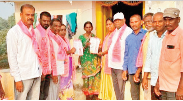
అమరచింత మండలంలో ప్రచారం చేస్తున్న బీఆర్ఎస్ నాయకులు