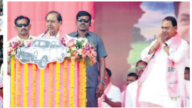
అధినేత స్వీచ్.. అల్లెల అభివాదనం