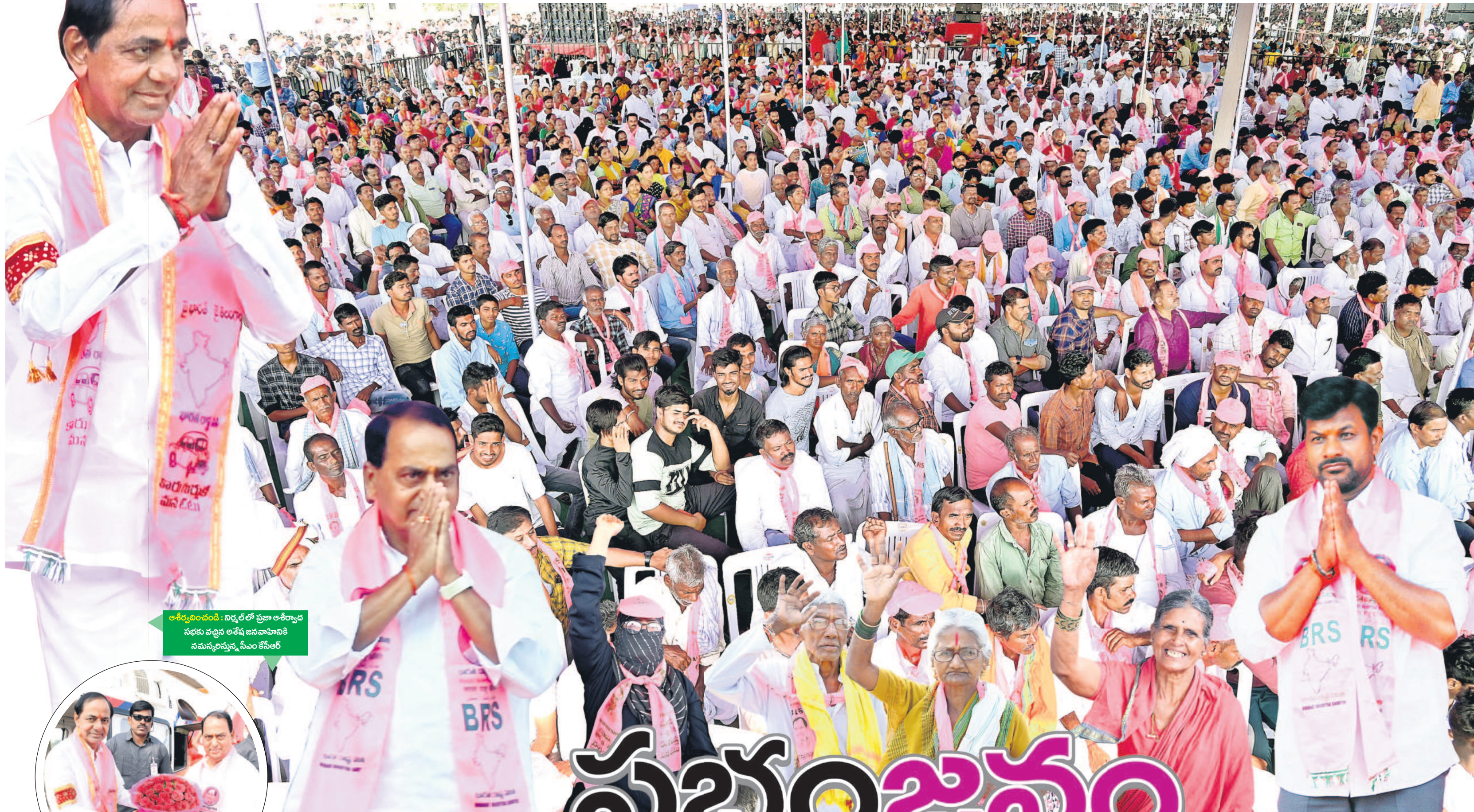
ఆశీర్వాదించండి : నిర్మల్ లో ప్రజా ఆశీర్వాద సభకు వచ్చిన అశేష జనవాహినికే నమస్కరిస్తున్న సీఎం కేసీఆర్