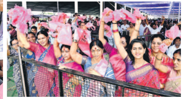
జెండా ఊపి.. జై కొట్టి