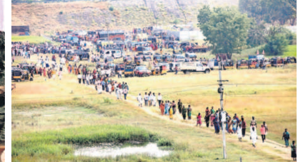
నిర్మల్ లో ప్రజా ఆశీర్వాద సభకు తరలివస్తున్న శ్రేణులు, ప్రజలు