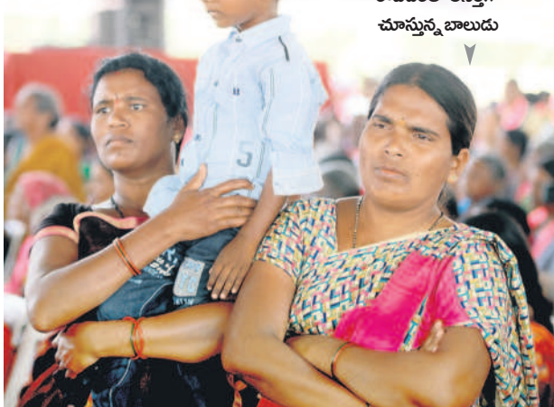
నిర్మల్ సభకు సీఎం కేసీఆర్ రావడంతో ఆనందంగా చూస్తున్న బాలుడు