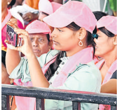
కేసీఆర్ తాత వచ్చింది