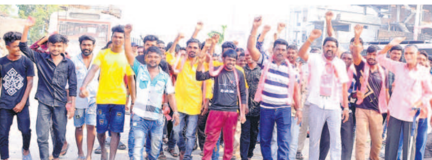
నినాదాలు చేస్తూ కేసీఆర్ సభకు వస్తున్న యువకులు