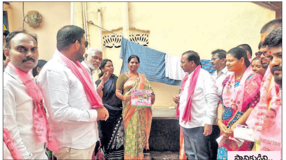
స్థానికుడిని.. సేవ చేసుకునే భాగ్యం కల్పించండి