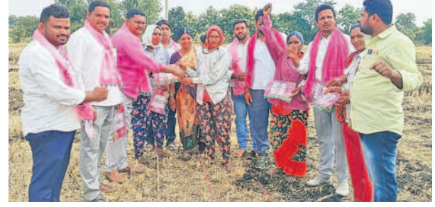
చౌడుతండాలో ప్రచారం చేస్తున్న బీఆర్ఎస్ గిరిజన నాయకులు