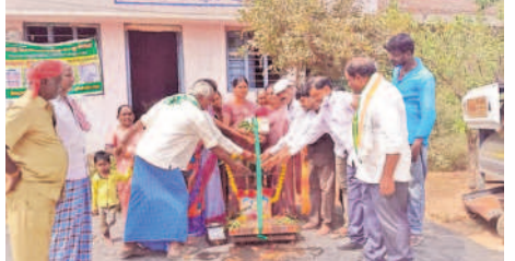
పోతారం(ఎన్)లో కొనుగోలు కేంద్రం ప్రారంభిస్తున్న అధికారులు