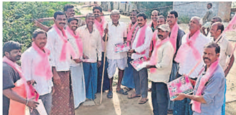
మోతూరు : కొండగడపలో ఇంటింటి ప్రచారం చేస్తున్న బీఆర్ఎస్ నాయకులు