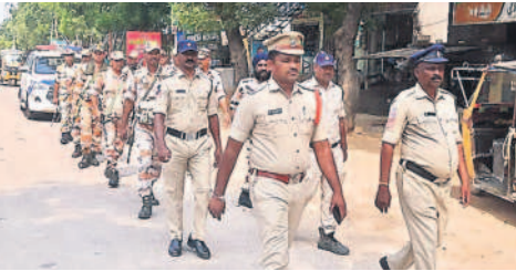
నూతనకల్ మండల కేంద్రంలో పోలీసుల కవాతు