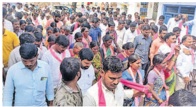
ఇందనూర్లో బీఆర్ఎస్ శ్రేణుల భారీ ర్యాలీ

అందరి చూపు..బీఆర్ఎస్ వైపు ఉందని, బీఆర్ఎస్లో భారీ చేరికలతో కాంగ్రెస్ నాయకులు