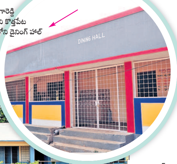
రంగారెడ్డి జిల్లాలోని కొత్తపేట జడ్పీహెచ్ఎస్లోని డైనింగ్ హాల్