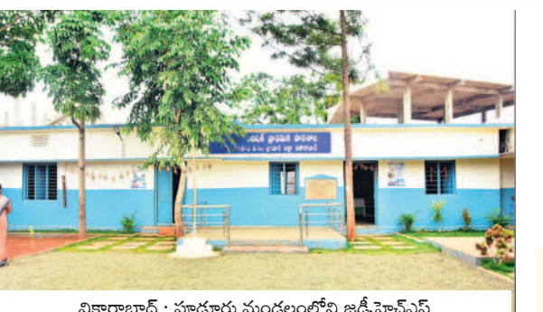
వికారాబాద్ : పూడూరు మండలంలోని జడ్పీహెచ్ఎస్