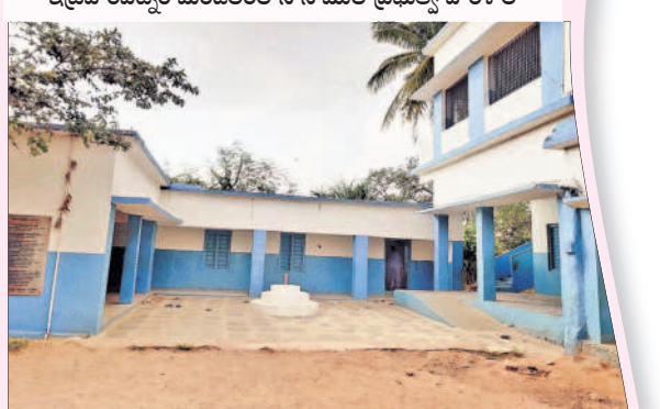
కడపల్ మండల కేంద్రంలోని ప్రాథమికోన్నత పాఠశాల