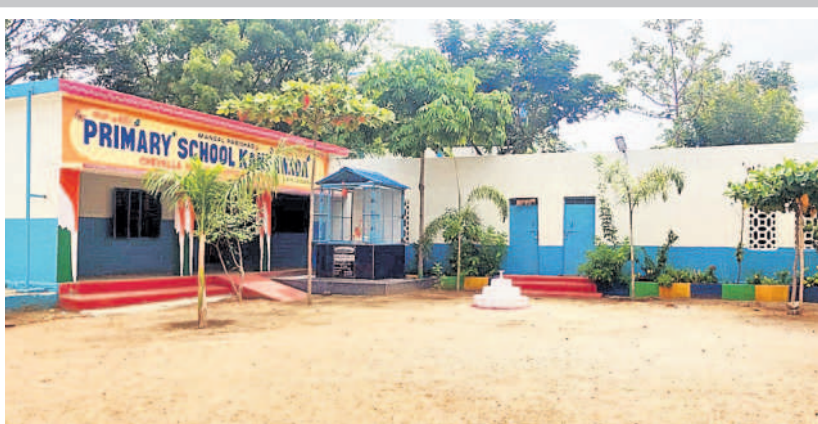
మన ఊరు - మన బడితో రూపురేఖలు మారిన చేపేళ్ల మండలంలోని కందమాడ ప్రభుత్వ ప్రాథమిక పాఠశాల