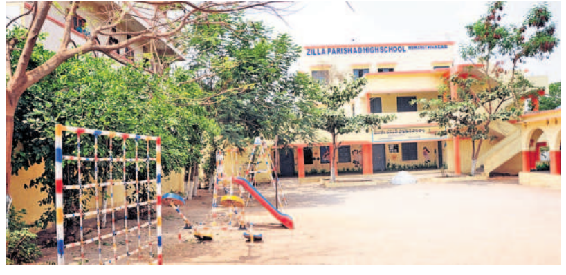
మొయినాబాద్ : హిమాయత్ సాగర్ లోని జిల్లా పరిషత్ హైస్కూల్