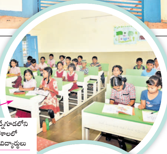
వికారాబాద్ : మన్నేగూడలోని ప్రభుత్వ పాఠశాలలో చదువుకుంటున్న విద్యార్థులు