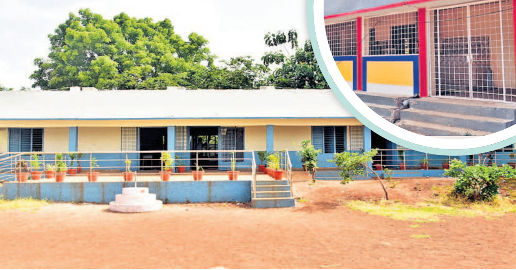
వికారాబాద్ జిల్లాలోని శివారెడ్డిపేట్ జిల్లా పరిషత్ హైస్కూల్