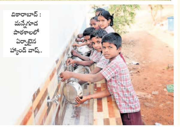
వికారాబాద్ : మన్నేగూడలో పాఠశాలలో ఏర్పాటు చేసిన హ్యాండ్ వాష్..