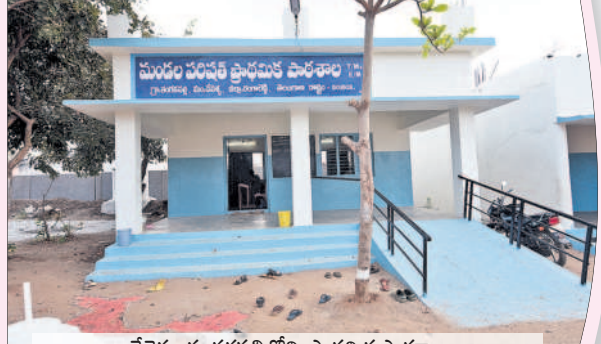
చేపేళ్ల : తంగడపల్లిలోని ప్రాథమిక పాఠశాల