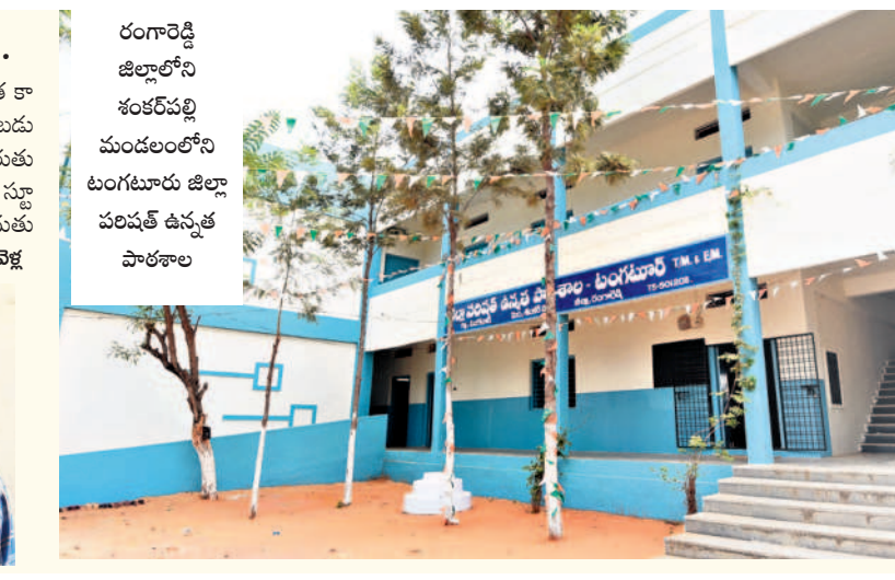
రంగారెడ్డి జిల్లాలోని శంకరపల్లి మండలంలోని టంగటూరు జిల్లా పరిషత్ ఉన్నత పాఠశాల

వికారాబాద్, నవంబర్ 2 (నమస్తే తెలంగాణ): సీఎం కేసీఆర్ విద్యారంగా భివృద్ధికి ఎంతో కృషి చేస్తున్నారు. కేజీ టూ పిజీ ఉచిత నాణ్యమైన విద్యనుందించేందుకు అవసరమైన చర్యలు చేపట్టారు. బీఆర్ఎస్ ప్రభుత్వం ఆధికారంలోకి వచ్చిన నాటి నుంచే ప్రభుత్వ పాఠశాలల రూపురేఖలు మారిపోతున్నాయి. ప్రభుత్వ బడుల్లో మౌలిక వసతుల కల్పనకు అధిక ప్రాధాన్యతనివ్వడంతోపాటు కార్పొరేట్, ప్రైవేట్ స్కూళ్లకు దీటుగా సర్కార్ బడులను తీర్చిదిద్దుతున్నారు. గతేడాది నుంచి ప్రభుత్వ పాఠశాలల్లో ఆంగ్ల మాధ్యమంలో బోధనను ప్రారంభించడంతోపాటు విద్యార్థులకు ఉదయం అల్పాహారం, మధ్యాహ్న భోజనం, ఉచిత పాఠ్యపుస్తకాలు, నోట్ బుక్స్, స్కూల్ యూనిఫాంలను అందిస్తూ ప్రభుత్వ పాఠశాలలను బలోపేతం చేస్తున్నారు.