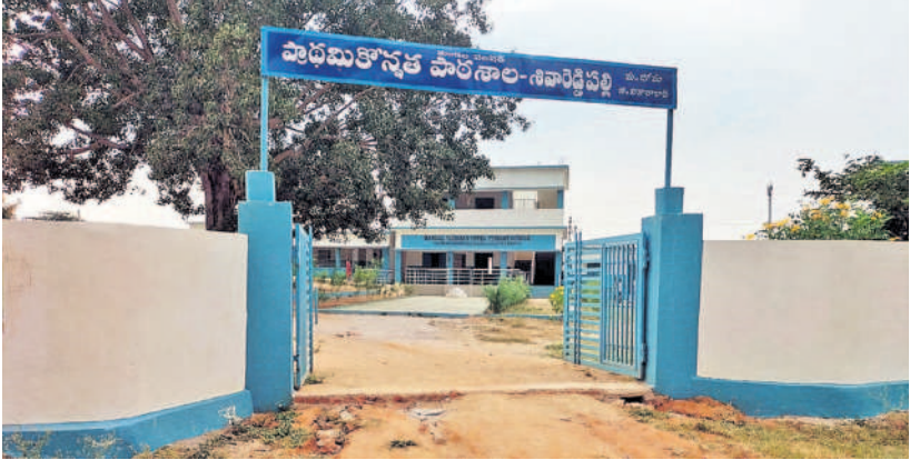
వికారాబాద్ : దోమ మండలంలోని శివారెడ్డిపల్లి ప్రభుత్వ పాఠశాల భవనం