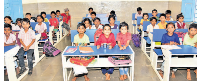
వికారాబాద్ జిల్లాలోని చంద్రయాన్ పల్లి గ్రామంలోని ప్రభుత్వ పాఠశాలలో ద్యూయల్ డెస్కలపై కూర్చుని పాఠాలు వింటున్న విద్యార్థులు