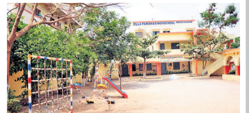
మొయినాబాద్ : హిమాయత్ సాగర్ లోని జిల్లా పరిషత్ హైస్కూల్