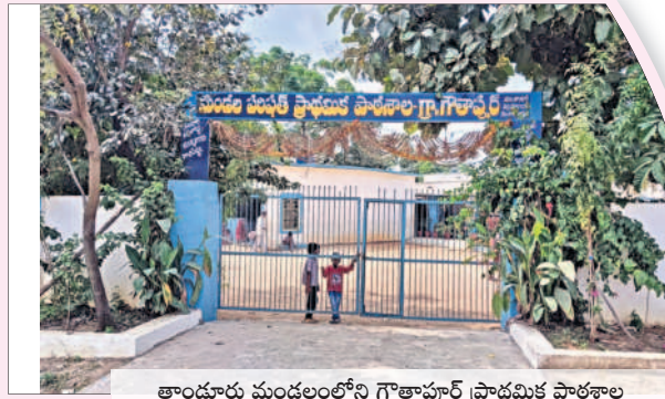
కాండూరు మండలంలోని గౌతాపూర్ ప్రాథమిక పాఠశాల