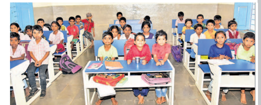
వికారాబాద్ జిల్లాలోని చంద్రయన్ పల్లి గ్రామంలోని ప్రభుత్వ పాఠశాలలో ద్యూయల్ డెన్సిటీపై కూర్చుని పాఠాలు వింటున్న విద్యార్థులు