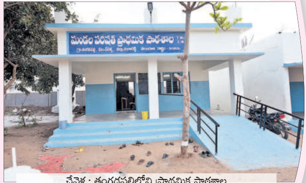
చేవేళ్ల : తంగడపల్లిలోని ప్రాథమిక పాఠశాల