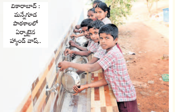
వికారాబాద్ : మన్నేగూడలో పాఠశాలలో ఏర్పాటు చేసిన హ్యాండ్ వాష్.