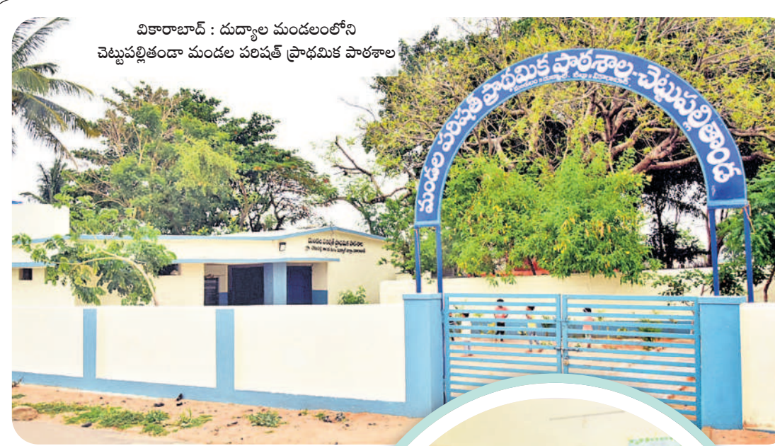
వికారాబాద్ : దుద్దాల మండలంలోని చెట్టుపల్లితండా మండల పరిషత్ ప్రాథమిక పాఠశాల