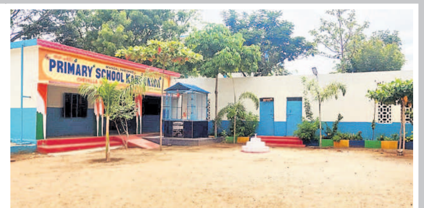
మన ఊరు - మన బడితో రూపురేఖలు మారిన చేవెళ్ల మండలంలోని కందమాడ ప్రభుత్వ ప్రాథమిక పాఠశాల