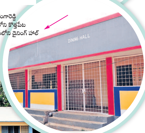
రంగారెడ్డి జిల్లాలోని కొత్తపేట జడ్పీహెచ్ఎస్లోని డైనింగ్ హాల్