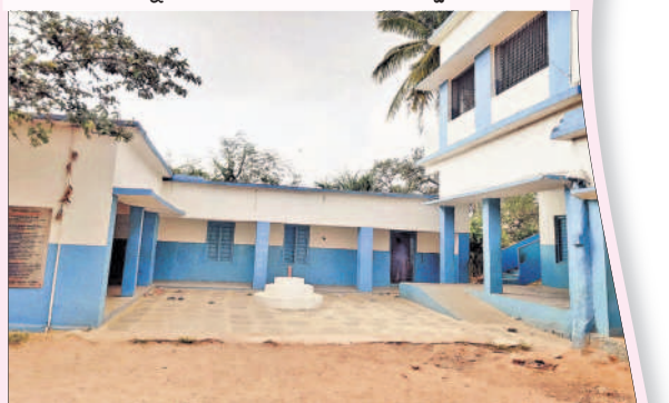
కడపల్ మండల కేంద్రంలోని ప్రాథమికోన్నత పాఠశాల