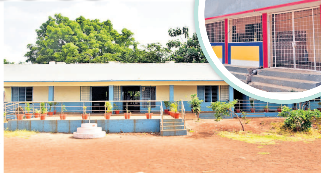
వికారాబాద్ జిల్లాలోని శివారెడ్డిపేట్ జిల్లా పరిషత్ హైస్కూల్