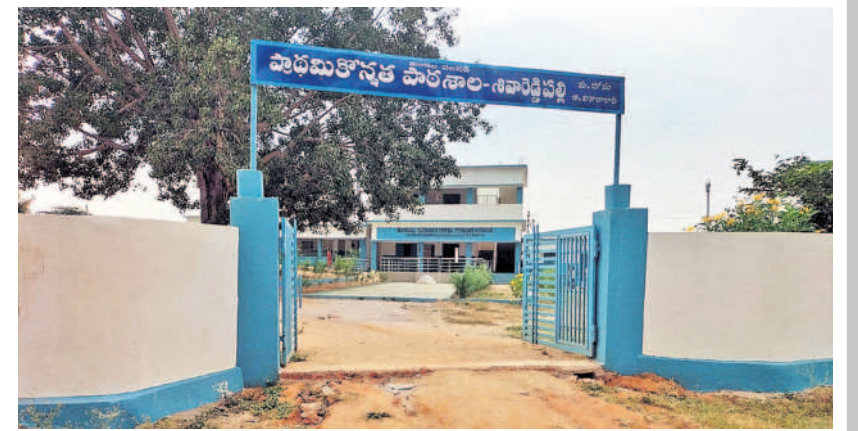
వికారాబాద్ : దోమ మండలంలోని శివారెడ్డిపల్లి ప్రభుత్వ పాఠశాల భవనం