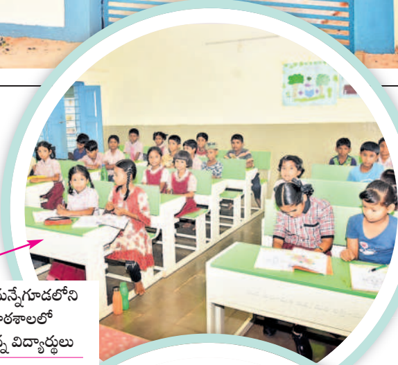
వికారాబాద్ : మన్నేగూడలోని ప్రభుత్వ పాఠశాలలో చదువుకుంటున్న విద్యార్థులు