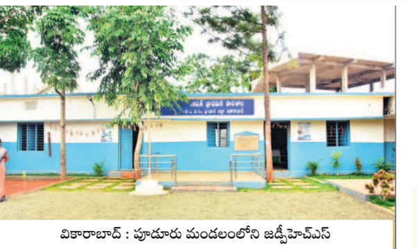
వికారాబాద్ : పూడూరు మండలంలోని జడ్పీహెచ్ఎస్