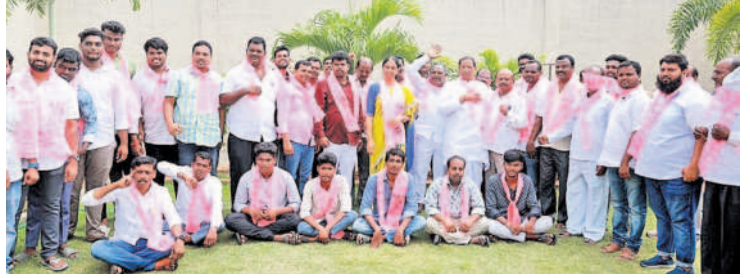
మంత్రి సబితా ఇంద్రారెడ్డి సమక్షంలో బీఆర్ఎస్ పార్టీలో చేరిన మహేశ్వరం నాయకులు

మహేశ్వరం, నవంబర్ 2: బీఆర్ఎస్ లోకి రోజు రోజుకూ వలసలు కొనసాగుతున్నాయని ప్రజలు బీఆర్ఎస్ కు అండగా నిలుస్తున్నారని రాష్ట్ర విద్యా శాఖ మంత్రి సబితా ఇంద్రారెడ్డి అన్నారు. గురువారం మహేశ్వరం, గంగారం, చిన్న తూప్ర గ్రామాలకు చెందిన నాయకులు అధిక సంఖ్యలో మంత్రి సమక్షంలో బీఆర్ఎస్ లో చేరారు. మంత్రి వారికి గులాబీ కండువలు కప్పి బీఆర్ఎస్ పార్టీలోకి ఆహ్వానించారు. కార్యక్రమంలో ప్రజాప్రతినిధులు, పార్టీ నాయకులు పాల్గొన్నారు.